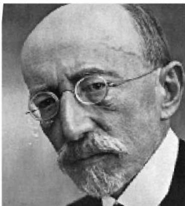
אחד העם. הנמסס של הרצל ומשבית השמחה