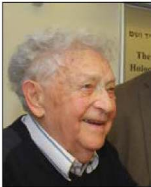
תא"ל יצחק ארד