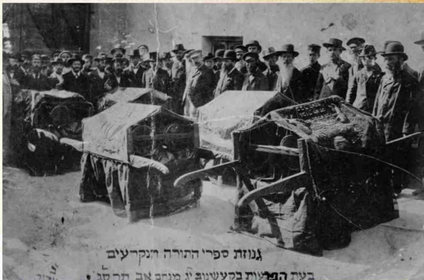
« הלוויית ספרי התורה שנשרפו באירועי הפרעות בקישינב

כאשר שב לאנגליה והחדשות על הפרעות בקישינב באו לאוזניו הוא הציע להרצל הצעה חדשה: "בנסיעתי ראיתי ארץ בשבילך", אמר להרצל, "והיא אוגנדה. בקרבת החוף חם מאוד, אך בפנים הארץ האקלים מצוין גם לאירופאים. אפשר לגדל שם סוכר וכותנה. והנה חשבתי בלבי, זאת תהיה ארץ טובה בשבילך".