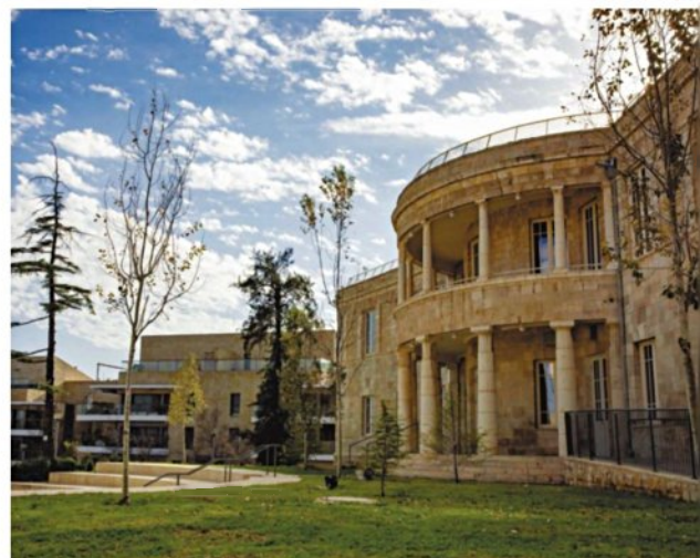
בית ההבראה ההיסטורי של ארזה וגדם העץ שנטע הרצל במו ידיו. למעלה: נוף הרי ירושלים הנשקף מהאזור