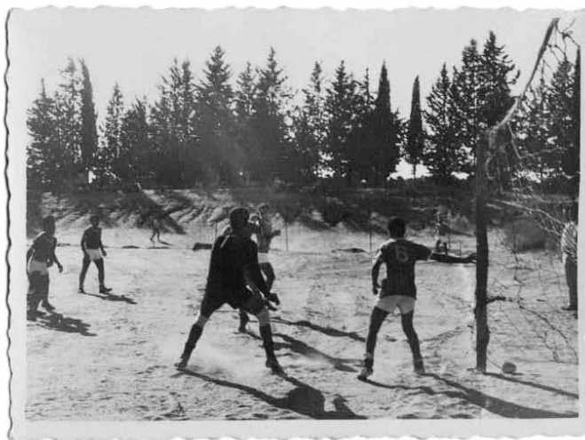
משחק כדורגל בבית צפאפא, שנות השישים של המאה העשרים

המועדון לנשים שנפתח בבית צפאפא בינואר 1953, ביוזמת מועצת הפועלות בהסתדרות, היה אחד הראשונים שהוקמו בכפרים הערביים. כעשור אחר כך ביקש הוועד הפועל של ההסתדרות לפתוח בכפר מועדון תרבות נוסף. הסתדרות הנוער העובד והלומד, שפעלה במסגרת מועצת פועלי ירושלים, הודיעה שבכוונתה לארגן הכשרות מקצועיות לבני הנוער בכפר וכן פעילויות משותפות עם בני נוער יהודים. 69 בראשית שנות השישים דווח על הקמתה הצפויה של קבוצת כדורגל בכפר, ביוזמת המחלקה הערבית במועצת פועלי ירושלים והמחלקה