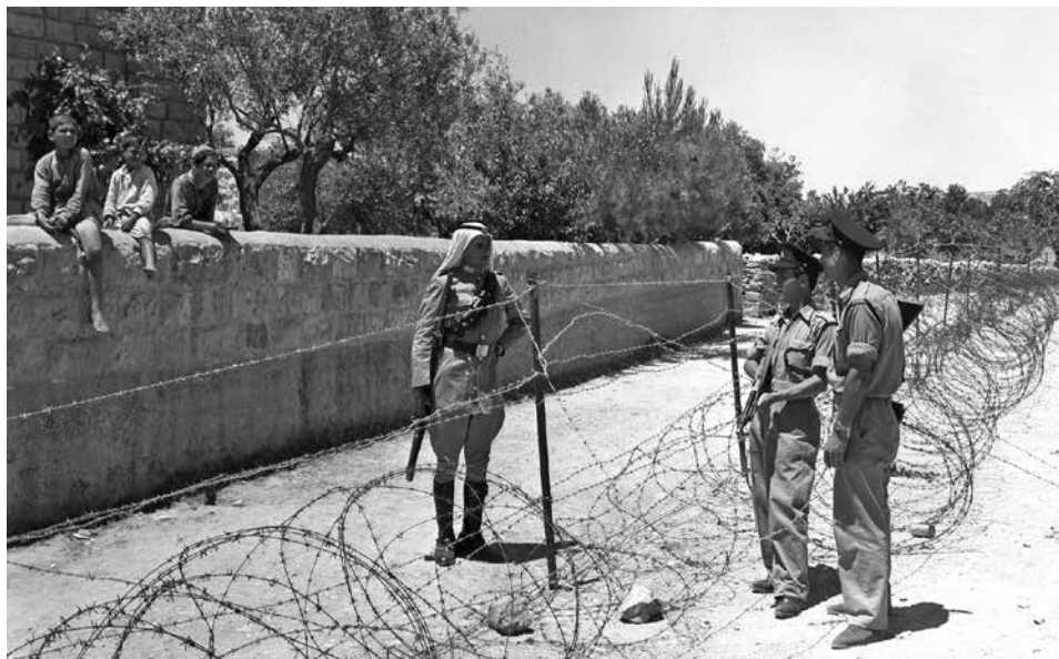
חיילים ישראלים משוחחים עם חייל ירדני משני עברי גדר הגבול בבית צפאפא

שפירא: בכל זאת זה בתחום ירושלים וזה נתקדש.