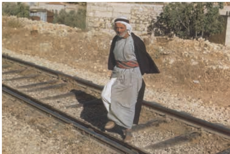
מסילת הרכבת סמוך לבית צפאפא, 1950

בראשית שנות החמישים שופץ המסגד, ומשרד הדתות נשא באופן חלקי בעלות העבודות. 64 לצורך העבודות ניתן לתושבי הכפר רישיון לרכישת שלוש טונות מלט – חומר בנייה שבכל הארץ היה אז מחסור בו. כשנה קודם לכן נקבע כי לנוכח המחסור במלט תינתן