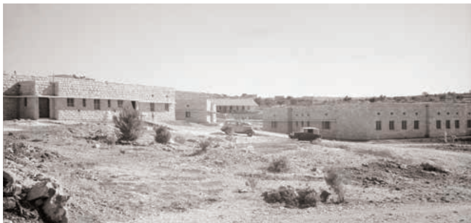
בית החולים הממשלתי למחלות מידבקות, ממזרח לבית צפאפא, 22 ביוני 1939

המפה המוסכמת בין הצדדים מה-23 באפריל 1949. התגלעה מחלוקת בעיקר סביב שלושה אזורים: בסמוך לקיבוץ רמת רחל ובשתי נקודות בסביבות בית צפאפא – ליד בית החולים וליד מקבץ של ארבעה בתים בחלקו הצפוני-מזרחי של הכפר. ארבעת הבתים אמורים היו להיוותר בצידו הירדני של הגבול אך בטעות נותרו בצידו הישראלי, כפי שהודה לימים הרמטכ"ל רב אלוף יצחק רבין. משא ומתן שנוהל עם דייריהם על אפשרות לפנותם ולפצותם כשל, ותיקון קטע הגבול לא בוצע. 24