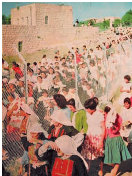
חתונת זוג תושבי בית צפאפא שנערכה משני עברי הגבול, 1962 (אלערבי, כוויט, אוסף מוצפאפא עותמאן)

בשנת 1963 נכללה בית צפאפא בתוכנית הארצית לחיסול משכנות העוני. 52 אלא שבשיקום הבתים הרעועים בכפר לא היה די, ותושביו היו זקוקים גם לבתים חדשים. הבנייה החדשה בכפר נתפסה כרגישה והצריכה את מעורבותם של משרד ראש הממשלה ומערכת הביטחון. בשנות החמישים נטה הצבא להתנגד לבנייה חדשה בכפר, על בסיס מה שהוגדר שיקולי ביטחון, אך נראה כי עתה נתפס המצב הביטחוני כמציאות קבע שאינה יכולה להצדיק התעלמות מצורכי הדיור הבסיסיים של התושבים.