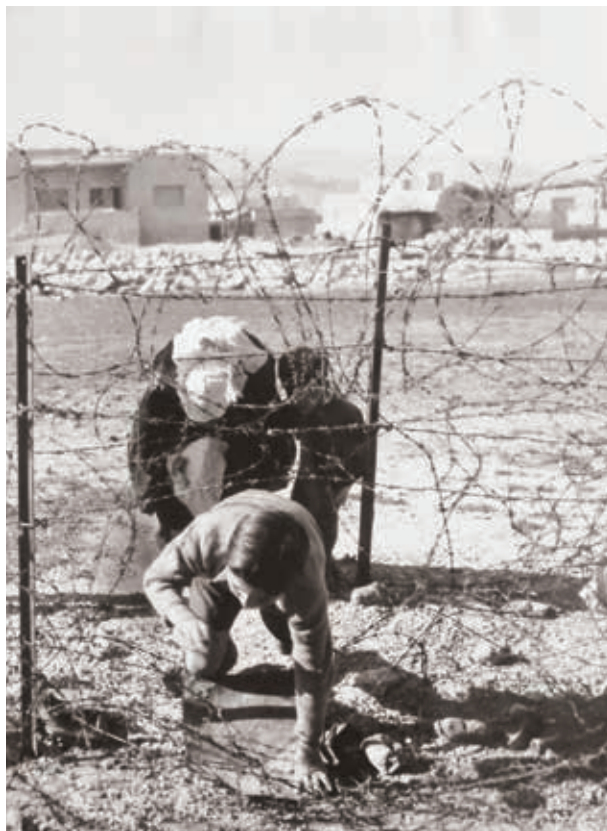
הסתננות מתחת לגדר הגבול בין שני צידי הכפר בית צפאפא, מחצית המאה העשרים (מאוסף המחברים)

הגדר שנבנתה בין שני חלקי הכפר מייד בתום מבצע 'שמשון' כדי לסמן את קו הגבול הייתה נמוכה וקלה למעבר. היא נחתכה ונרמסה על ידי תושבי הכפר מדי פעם, וכאמור לא מנעה תנועה מתמדת וכמעט לא מופרעת בין שני חלקיו. יותר משנועדה להוות מכשול בלתי עביר נועדה גדר זו לסמן את תחום הריבונות הישראלית, ולפיכך הייתה בעלת משמעות מדינית. הגדר לא הועילה במניעת הברחות בין שני צידי הכפר, ואלו היו דבר שבשגרה. מצידו הירדני של הכפר הוברחו לישראל, דרך צידו הישראלי, מגוון סחורות - ממוצרי מזון וסדקית ועד תכשיטי זהב ושעונים - ואלה נמכרו בין השאר בשוק מאולתר שפעל במעברת תלפיות, שהייתה סמוכה לכפר מצפון. בעיית ההברחות הייתה קשה במיוחד בשנות החמישים, בתקופת הצנע, שבמהלכה הורגש מחסור חריף במוצרים רבים, אולם היא נמשכה גם בשנות השישים. 22