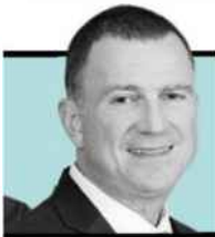
/ יולי אדלשטיין

רבים בטוחים שאין פתרון לסוגיית יום המנוחה, והם טועים. מדוע שבקריית־ארבע ובקריית־ביאליק תיראה השבת אותו דבר?