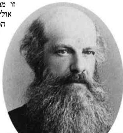
משיחיסט מוזר, חולם ואיש מעשה. אוליפנט

אימבר יצא לווינה, כתב עוד שיר וקיבל עוד כסף, שחלק ממנו שלח לאמו. משם יצא לנדודים במחוזות בסרביה וברומניה והתפ-רנס משיעורים פרטיים. בעיר יאסי התוודע לברון היהודי משה ולדברג. הברון נכבש בק-סמיו והזמין אותו לגור בביתו.