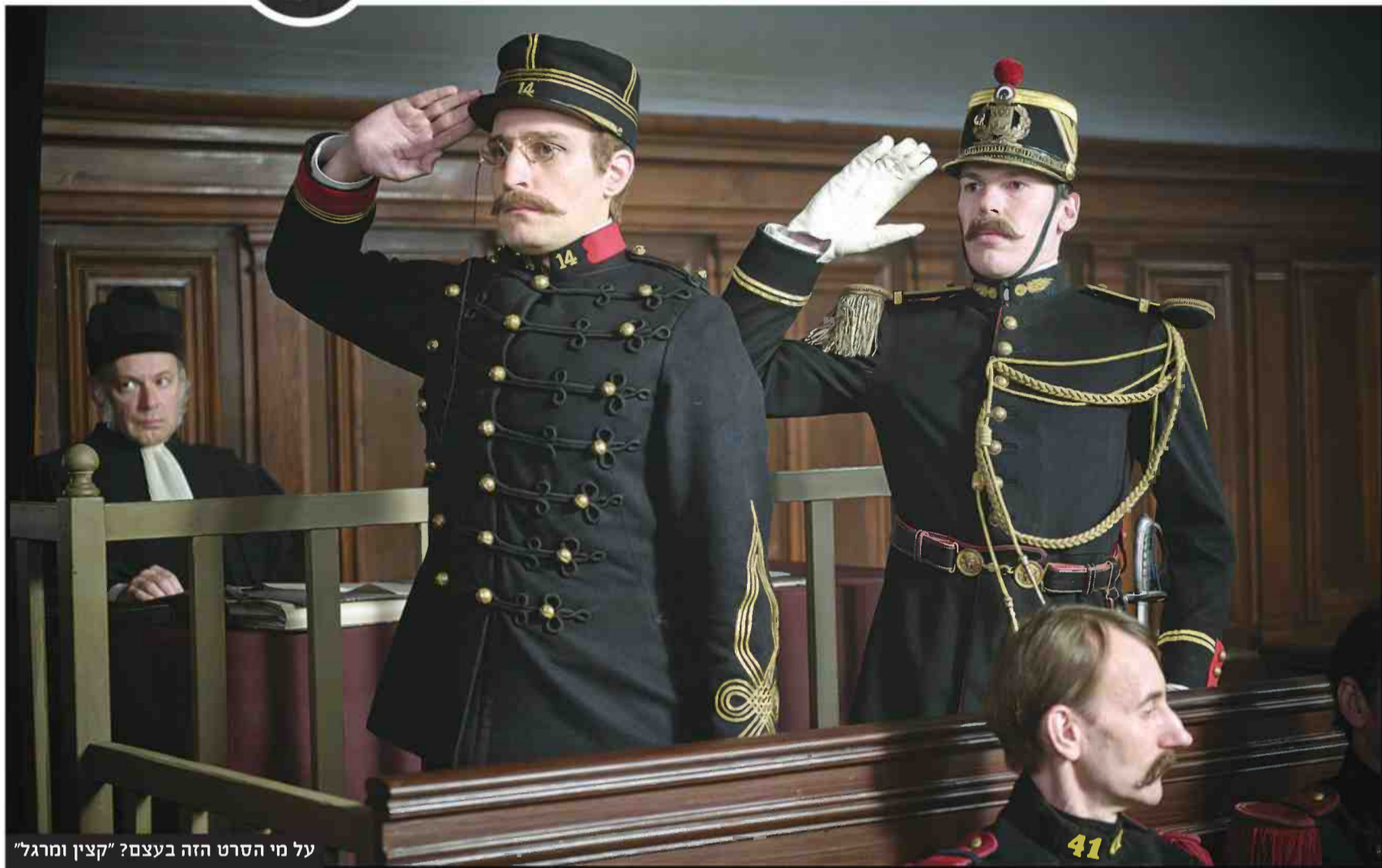
על מי הסרט הזה בעצם? "קצין ומרגל"

נערכים המהלכים שקבעו את גורל הרפובליקה השלישית, הוא נותר פיון. לואי גארל, המגלם את דרייפוס, אכן מממש אותו ככלי משחק בלבד, ולא כאישיות העומדת בזכות עצמה. כאן המקום לציין שבכתבים של בני הדור ההוא, דווקא אלה שתמכו במשפט צדק לדרייפוס, ניכרת אכזבתם מאפרוריותו האישית. היה זה הסופר אנטול פראנס, מהמצדדים בקורבן היהודי, שהביע כך אכזבתו ממנו: "דרייפוס הוא ממש כמו הקצינים שהרשיעו אותו. אילו היה בנעליהם, הוא היה מרשיע את עצמו". ואכן, גארל מעצב אותו כמו איזה דג מלוח חסר חן או יחוד.