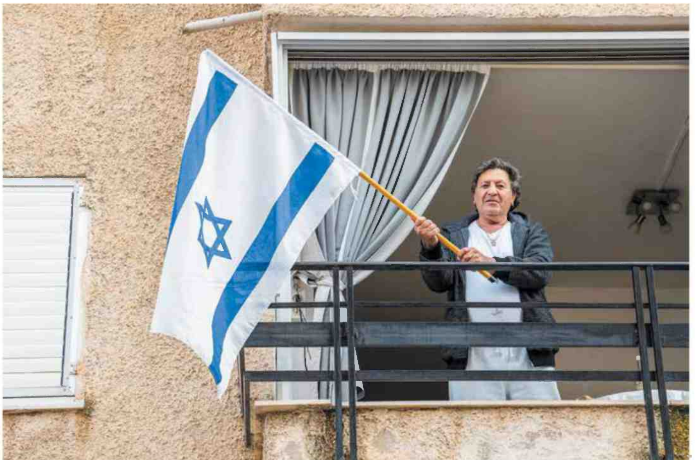
השבע לא מבין את הרעב. תומך ליכוד מנופך בדגל במרפסת טבריינית

ביבי לא אשם? לא מדויק. הצלחה הכלכלית של עידן נתניהו מבוססת על הגישה של העצמת השוק הקטנת הממשלה והחלשת המדינה. אבל כאשר המדינה חלשה, אין ביכולתה לסייע לאזרחי חולשה כמו טבריה. היא אינה יודעת כיצד למשות מן הכישלון קבוצות אוכלוסייה שלא מצליחות לדאוג לעצמן. ועל כן, שלא בכוונה, היא מפקירה אותן. היא לא עושה למענו את המינימום שבמינימום שסוציאלי־דמוקרטיה מודרנית יודעת לעשות. אבל הסיפור עמוק עוד יותר. בסוף־בסוף, המהפכה הציונית הייתה גדולה על טבריה. האוכלוסייה היהודית הוותיקה שלה לא הייתה גדולה חזקה דייה לקלוט כהלכה את העלייה ההמונית שהגיעה מיד אחרי הקמת המדינה. העיר אמנם שילשה את אוכלוסייתה בתוך עשור, אבל כמו קרסה אל תוך עצמה. בניגוד למקומות אחרים בארץ, לא הייתה בה די עוצמה פנימית לעמוד בהלם הדמוגרפי ובכאב הרב שהמהפכה חוללה. בייסורים של עלייה וקליטה ורחייה. על כן, כמו בן מסוים, טבריה מעולם לא התאוששה מהטראומה של שנות החמישים. היא לא הצליחה לאזן את עצמה ולייצב את עצמה. אחרי