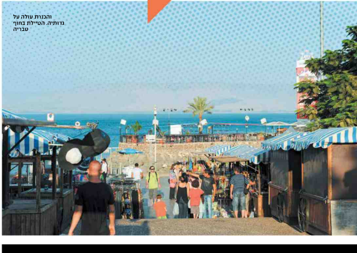
והכנרת עולה על גדותיה. הטיילת בחוף טבריה

מה ששמעת מרונית מראיג אותי, הוא מוסיף. שמעת את זה גם ממלי, ואני שומע את זה בעיר ובקניון ובהרבה מקומות. יש חלק בליכוד שהתעייף. יש ליכודניקים ששטיפת המוח של התקשורת חדרה אותם. לא נעים להם לתמוך במועמד שיש נגדו כתבי אישום. או יש פה מלחמה גדולה על הנשמה של הליכוד: האם מחזיקים חזק או האם נשברים. ואני חושב, אומר אבי, שהעניין של המפלגות הערביות יעזור. זה משחק לטובת ביבי, כי גנץ ולפיד הראו את הפנים האמיתיות שלהם: הם שמאל. ואשכנזי, שמאוד החזקתי ממנו, נהיה מין גולנצ'יק של צפונים. לאנשים שהם מרכזימין יהיה קשה יותר להצביע לכולם לבן. גם ליברמן לדעתי ירד. הוא עבד על הרבה אנשים הרבה זמן, אבל עכשיו מבינים שהוא פשוט בקטע קשה נגד ביבי. אישיאישי. אם ביבי באמת יחרוש את הארץ וישרוף את השטח, הליכוד יחזור, הימין יתעורר. אנשים יבינו שבחירות 2020 הן הכי חשובות שהיו פה. הבחירות שיקבעו עשרים שנה קדימה. ואם בעזרת השם יהיה ניצחון - וואלה מה יהיה פה. זה יהיה יותר מאשר המהפך של 1977. זה יהיה האמיאמא של כל המהפכים. ■