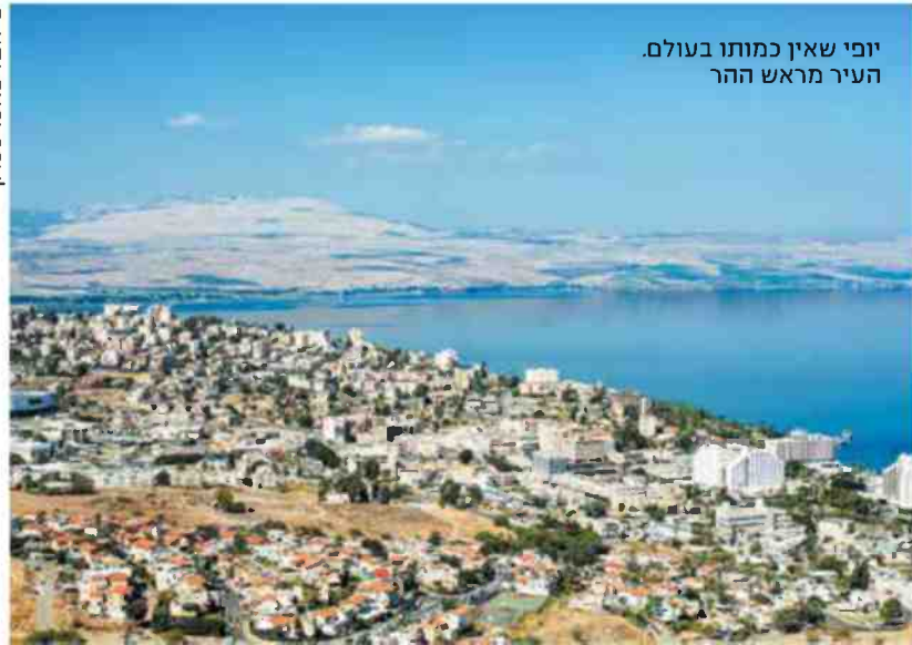
יפני שאין כמותו בעולם. העיר מראש ההר