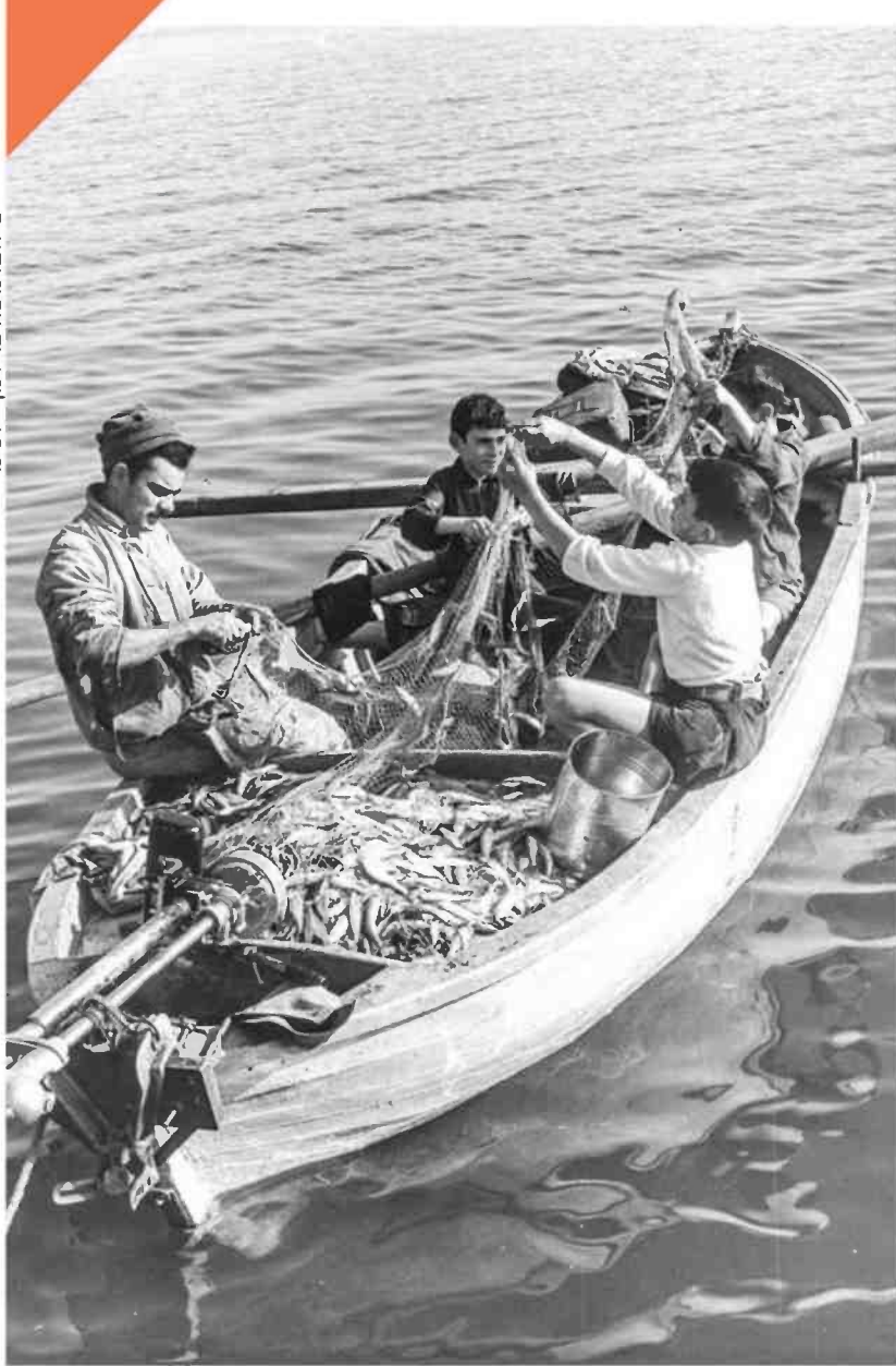
מתחת לפיתוח בשנות החמישים והשישים, זעם כבוש הלך והתעצם. דייג בטבריה, 1955