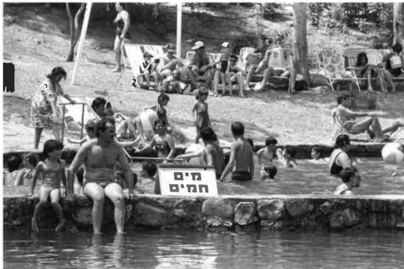
כבר לא המיזם הכלכלי הגדול של העיר. חמי טבריה, 1986