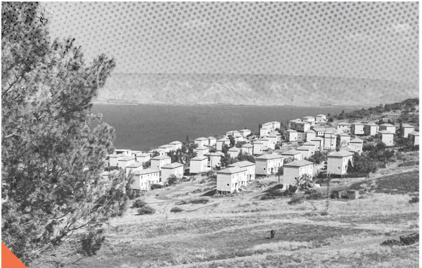
מפא"י שידרה עוצמה בשיכונים, עד שפירמידת הכוח נשברה. טבריה, 1959

ריבודי ששבה אותנו וסגר עלינו. המהפך שינה את כל זה, יבגי ממשיך. הוא פתח בפנינו שוק עצום של הזדמנויות. והוא הקנה את התחושה שעכשיו גם אנחנו חלק מהמדינה. שאנחנו לא יושבים עוד בשורות האחרונות של האוטובוס. בשבילנו זה היה כמו השחרור של השחורים באמריקה. בגין היה הלינקולן שלנו. עכשיו אפשר היה סוף-סוף לזקוף את הראש ולא להתכייש יותר במי שאנחנו. במקום שממנו באנו. במה שהאבות והאמהות שלנו העניקו לנו.