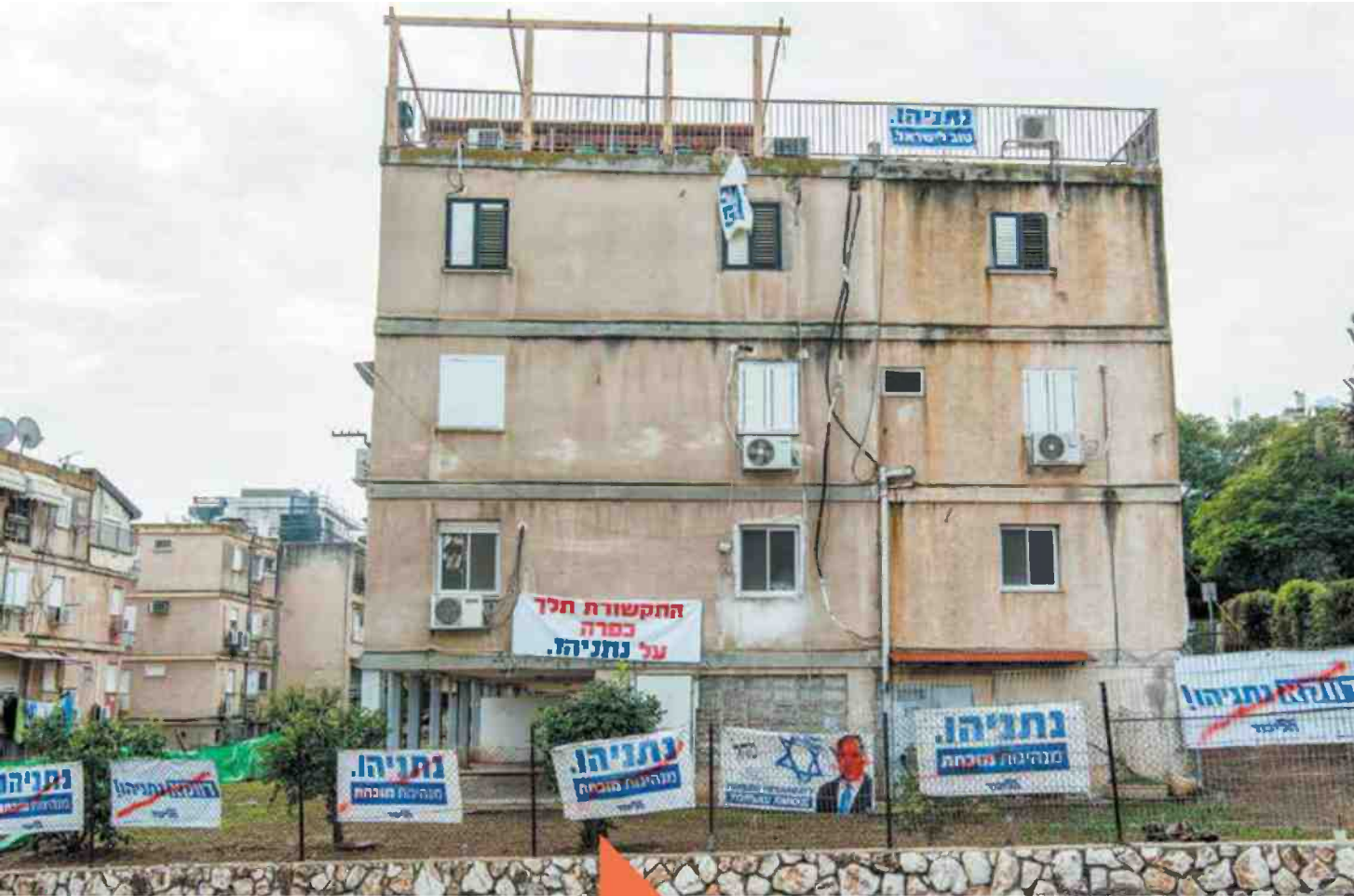
"לגנוץ בחיים לא אצביע. אבל אולי לא אצביע בכלל". בית בטבריה