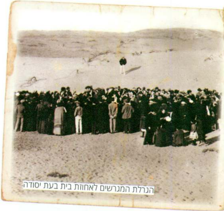
הנרלת המגרשים לאחוזה בית בעת יסודה