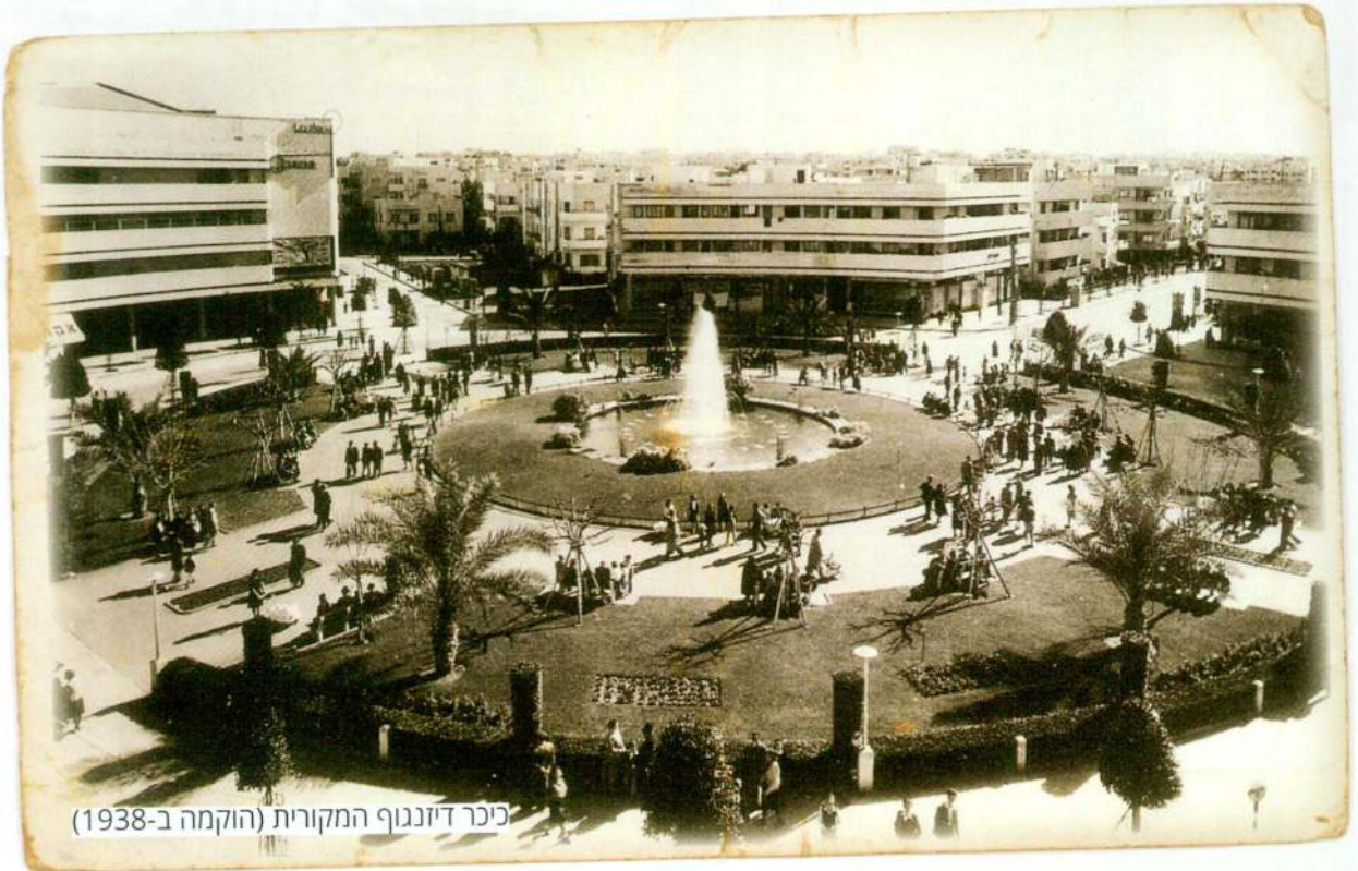
כיכר דיזנגוף המקורית (הוקמה ב-1938)

"אני מציע לרכוש אדמה ולבנות עיר עברית! יש בידי תוכניות מפורטות כיצד נעשה זאת. זו תהיה עיר מודרנית ומרווחת, לא נרשה צפיפות ולכלוך, לא תהיינה חנויות בעיר, אלא שטחים פתוחים, וניטע בהם גינות ופרדסים. זו תהיה עיר מלאת בריאות, וידברו בה עברית לתפארת עם ישראל"