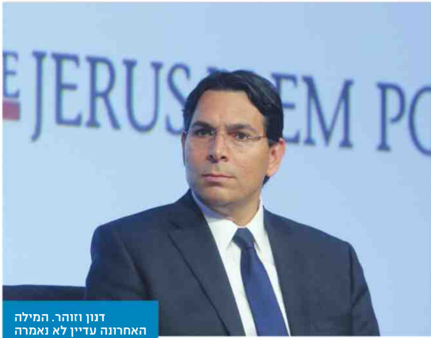
דנון וזוהר. המילה האחרונה עדיין לא נאמרה

אז דנון נעמד בפינה וחיכה שם לזוהר. הוא לא היה שגריר באוסטרליה? אז זוהר לא יהיה יו"ר הליכוד. עכשיו הוא חוגג. מבחינתו, כל הדילים בין זוהר לחגואל לא קשורים אליו. זוהר, לעומתו, מעיד בפורומים סגורים שדנון היה חלק מהעסקה כולה והיה "בתוך החדר" בכל הפגישות. כך או אחרת, המצב משעשע. זוהר נבגד על ידי כולם, דנון עשה לו כניפה אדומה, דנון מטריל עכשיו את נתניהו, וכולם דורשים להדיח את כולם מכל התפקידים ובכלל. מה שנותר לנו זה לאחל בהצלחה לכל הצדדים ולהמתין בדריכות לפרקים הבאים. ❖