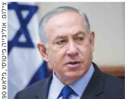
"אישיאיש ואורח חייו". נתניהו

ד"ר אבן מצביע על מכנה משותף בין השניים: שניהם היו נואמים בחסד עליון ושילבו בנאומיהם סממנים תיאטראליים. ז'בוטינסקי היה רב אמן של הגייה עברית במבטא ספרדי, ואף הדריך בכך את שחקני הבימה בביקורם בברלין. בגין היה מלהיט כיכרות שאין כמותו