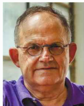
מוטי גולני. היסטוריה אלטרנטיבית

לקראת מינויו לנשיא המדינה. וייצמן, כהרצל, סלד מביקורים בפלשתינה, אך נע כבן בית בין לשכונת מנהיגים. הוא קיים קשר מתמשך עם הנשיא טרר- מן וגייס את תמיכת אמריקה בתוכנית החלוקה, נועד עם הנ- שיאים וילסון וקולידג', ויחד עם אשתו נרה – זו שלא יכול היה איתה ולא בלעדיה – היה מקורב לאלניור רוזוולט ול- בעלה הנשיא. שתדלן רביקסס ומדינאי מחונן, שצבר ארב- עה עשורים בשליחות ציבורית ואינספור מגעים מדיניים, גם ממיטות חוליו, וידע להתנער מתבטויות, לספוג חיצו- להתעשת ולהמשיך.