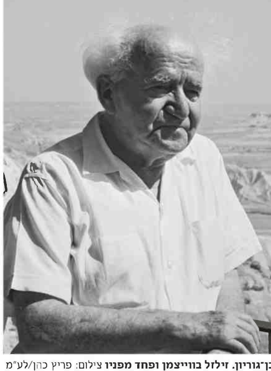
בן-גוריון. זילזל בווייצמן ופחד מפניו