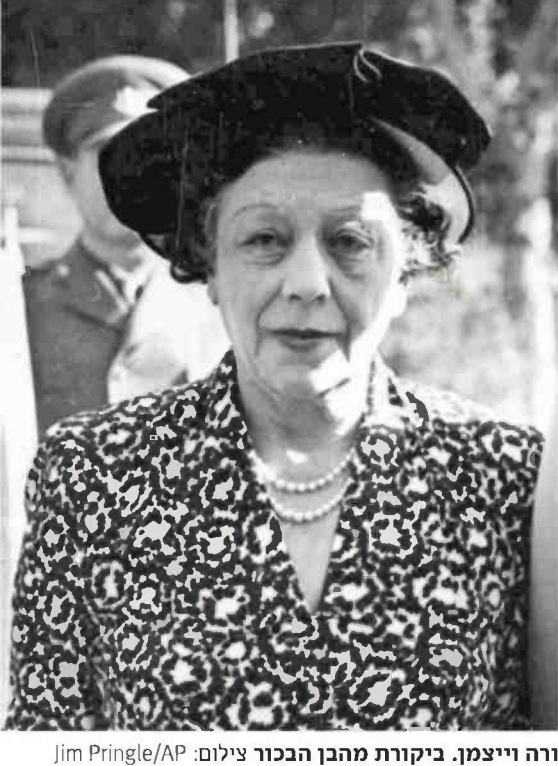
ורה וייצמן. ביקורת מהבכור