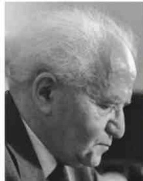
דוד בן-גוריון. יומני המלחמה שלו לא צונורו

הדיון בסוגיית האונס, גם אם אינה מרכזית לספר, מדגים את שיטת עבודתו של פפה. ואם אי אפשר לסמוך על העובדות שהיסטוריון