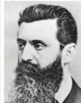
בנימין זאב הרצל. שתי שורות מיומנו