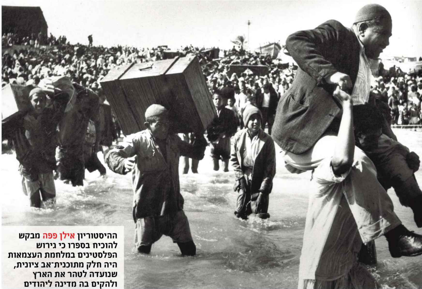
פליטים פלסטינים ב-1948. כיצד המושג "בריה" נהפך לכלי תעמולתי?