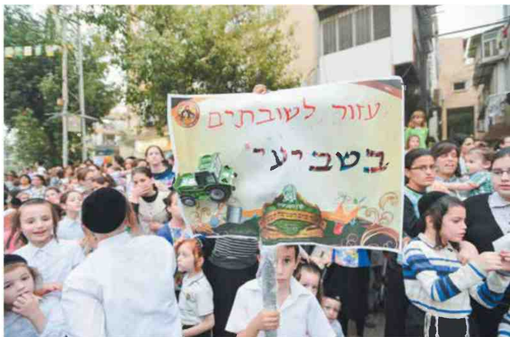
ההלכות תמיכה בחקלאים השובתים בשמיטה, בני ברק 2015

כיום מתגורר לביא (39) עם רעייתו ליאת החמשת ילדיהם בגרעין הרתי במושב שובה בנגב, שהוא אחד