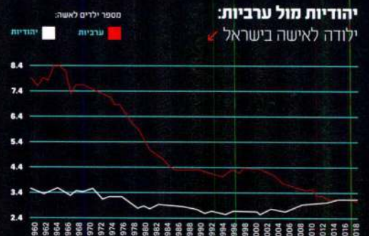
יהודיות מול ערביות: ילודה לאישה בישראל