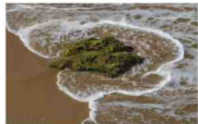
"תהליך בחירת התמונות היה ארוך ומרגש". מתוך התערוכה