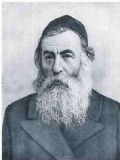
הרב ריינס צילם: מתוך ספר הציונות הדתית, כרך ראשון, בערכת יצחק רפאל ושו.ז. שרגא, הוצאת מוסד הרב קוק

הדברים נכתבו מסיבות טקטיות, שכן מאמירות אחרות של הרב ריינס ומכתבים אישיים שהותיר עולה בכירור שהוא קישר בין הציונות והגאולה, אך בספרו