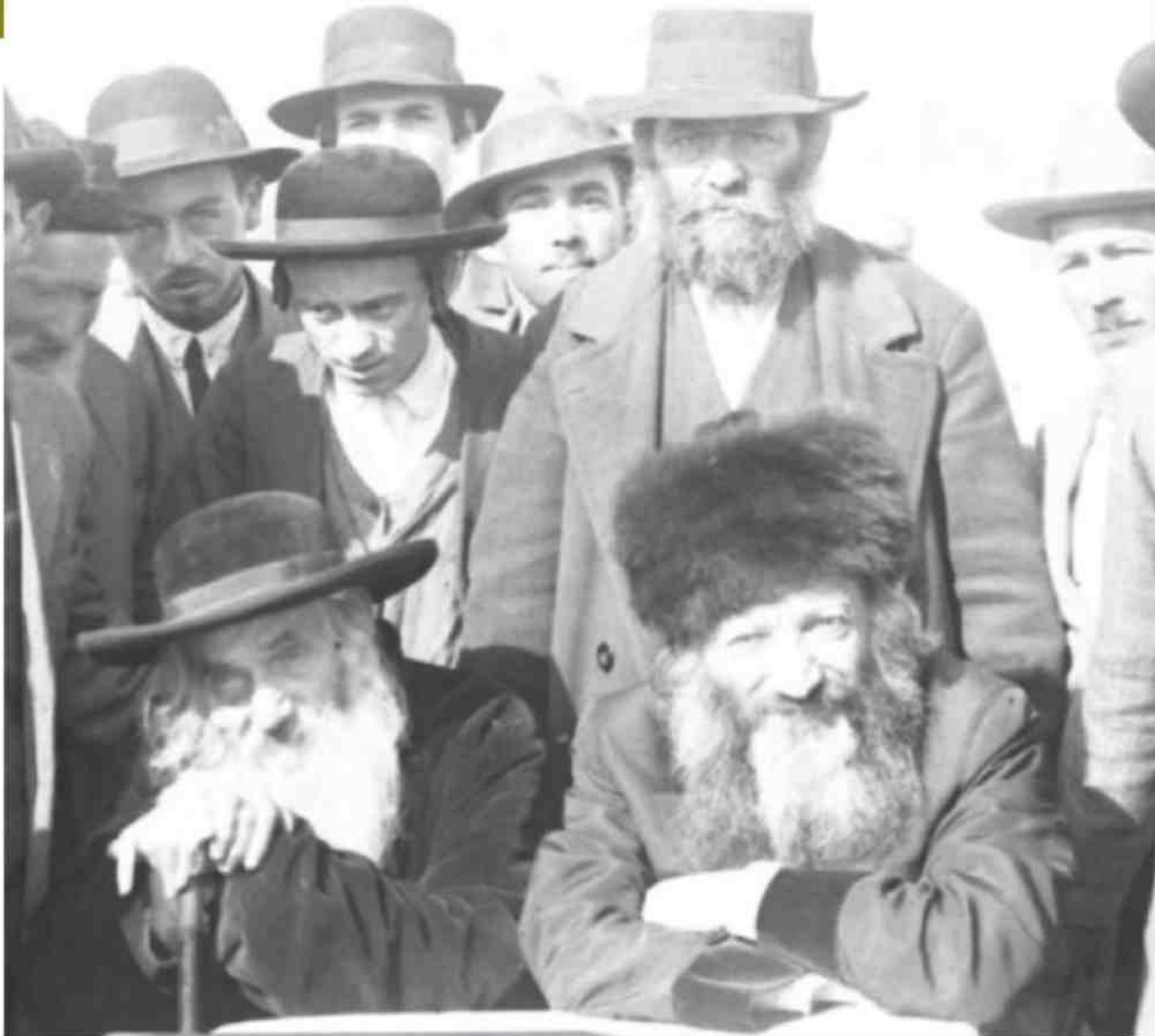
גדולי התורה החרדים הסתופפו בצילו של הרב קוק והעריצו אותו. הרב קוק והרב יוסף חיים זוננפלד