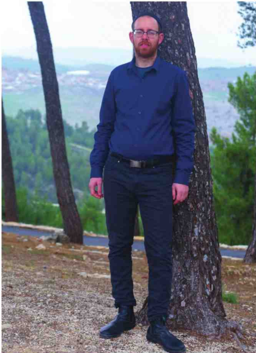
"ביהדות יש ערך עצום לידעת ההיסטוריה". נחמני

"העניין של אחדות ישראל מאוד מעניין אותי ומעסיק אותי. אם ניקח את הסמלים החרדיים ונחפור בעברם, נגלה את הרקע הציוני שלהם. בני ברק, עיר התורה והחסידות, הוקמה בתמיכת ארגון המזרחי ובליווי הצמוד של הרב קוק, כפי שהראיתי בספר 'חלוצים לציון'. רבני העדה החרדית בשנותיה הראשונות עסקו לפני כן בפעילות ציונית. גדולי התורה החרדים הסתופפו בצילו של הרב קוק והעריצו אותו. בעיניים של היום קשה לתפוס זאת, כי התרגלנו שיש חרדים ויש דתיים לאומיים, אבל באותה תקופה, בשנות העשרים והשלושים של המאה העשרים, כל האורתודוקסים