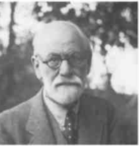
תוד פרויד