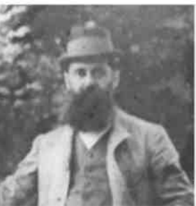
השראה לספרו. הרצל