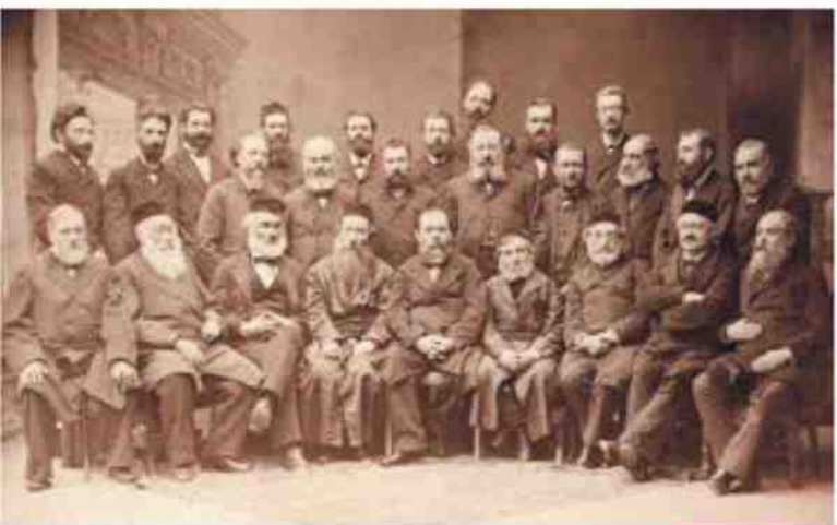
משתתפי כינוס של קבוצות "חובבי ציון" בקטוביץ ב-1884 התכנסו כדי לתת מענה לצורך של מדינה יהודית. במרכז השורה הראשונה יושבים הרב שמואל מוהליבר וד"ר ליאון פינסקר

הרב ריינס הגיב בתובנה יוצאת דופן. את מצוות ארבעת המינים מבינים כמייצגת באופן סמלי אחרות בין סוגים שונים של יהודים: בעוד שלאחרונה יש גם טעם משוכח וגם ארומה נעימה, המייצגים יהודים המחויבים לתורה ולמעשים טובים, למינים האחרים יש רק אחת מהתכונות הללו או אף אחת מהן. הרב ריינס