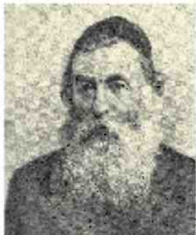
הרב ריינס

בכניסה של גישה פורצת דרך זו עומדת אמונה בלתי מעוררת בערכו הבלתי נתפס של העם היהודי בכללותו, ובנחיצות שיתוף הפעולה והשותפות עם קבוצות אחרות בתוך אומתנו. זוהי מחויבות אותנטית לאהבת אחינו היהודים, פיתוח אחווה ויחס של אחריות הדדית. ברגע שנוצרים קשרים משותפים עמוקים, אנחנו יכולים וחייבים לעשות את המאמץ לעצב גורל משותף. ערכי התורה שלנו הם תמצית קיומנו, נשמת הגוף הקולקטיבי שלנו, המרכז הרוחני שלנו. הארץ ומדינת ישראל הם חלק בלתי נפרד מהגורל שלנו. עם אמונה עמוקה ובלתי מעוררת במסע משותף שיש לטייל בו ביחד, נוכל להתגבר על כל אתגר, גדול ככל שיהיה. בדרך משותפת אפשר ליישב הברלים אידיאולוגיים שלכאורה בלתי ניתנים לתיקון.