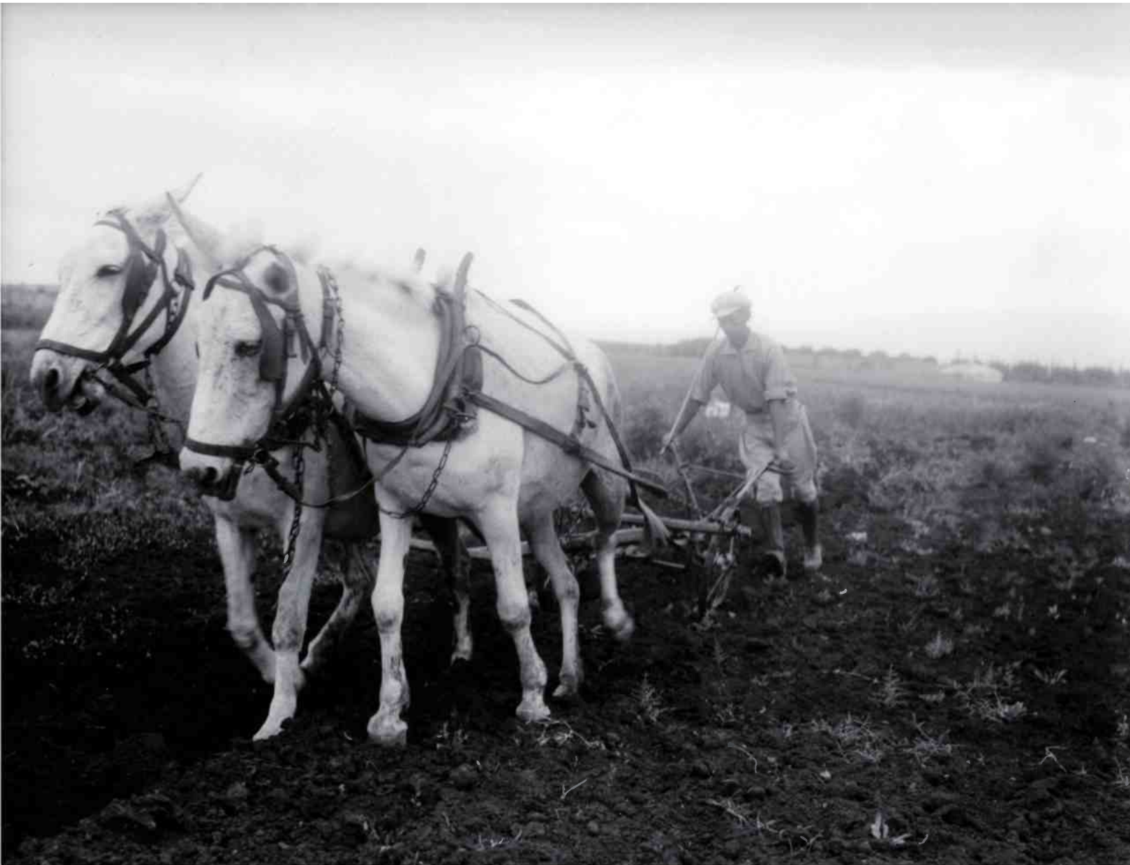
עין חרוד, 1934. מנקן התרשם מהקיבוץ, אך הטיל ספק ותהה "אם זה יחזיק"

הארץ שמארק טוויין מצא כאן היתה לדבריו משמימה, שוממה, אומללה עד גיחוך ומגוחכת עד אמלול. התמונה, כפי שצוירה בידי גדול סר-פריה של ארה"ב, שימשה היטב את הטיעון הרואה בציונות גורם שהושיע את הארץ מעלי-בותה הממארת. טוויין ומנקן פוגשים בהפרש של 67 שנה שתי פלסטינות שונות: הראשונה היא ארץ של קוסמופוליטיות עותמאנית, שמת-חילה בחוף ונגמרת איפה שהסולטן מחליט, ואילו השנייה היא ארץ הכלואה ברשת של קווים אקראיים ששורטטו על מפות של גנרלים אירופאים, והפכו אותה לזירת מלחמת אזרחים ששיאה תמיד לפניה. ביקוריהם הנפרדים של השניים מזכירים את האדונים לכנברג וקינגסקורט - גיבורי הרומן "אלטנוילנד" של תיאודור הרצל מ-1902 - שביקרו בפלסטינה הרדומה רגע לפני הצאת הפתיל החלוצי, וחזרו כעבור 20 שנה כדי למצוא בה חברת מופת ציונית פורחת ומשגשגת. ואפשר גם כך: כשמארק טוויין ביקר בארץ, תיאודור הרצל היה רק בן שבע; כשמנקן ביקר בארץ שמעון פרס כבר היה בן 11. ועכשיו מנקן על הרציף בנמל חיפה, בגבו לים עם מוודה ביד: "רעבוני למקומות קדושים, אני מודה, הוא מתון בלבד", יכתוב מיד ברשימותיו, כמו מתריס נגד רוח המפרץ שהסתחררה מולו