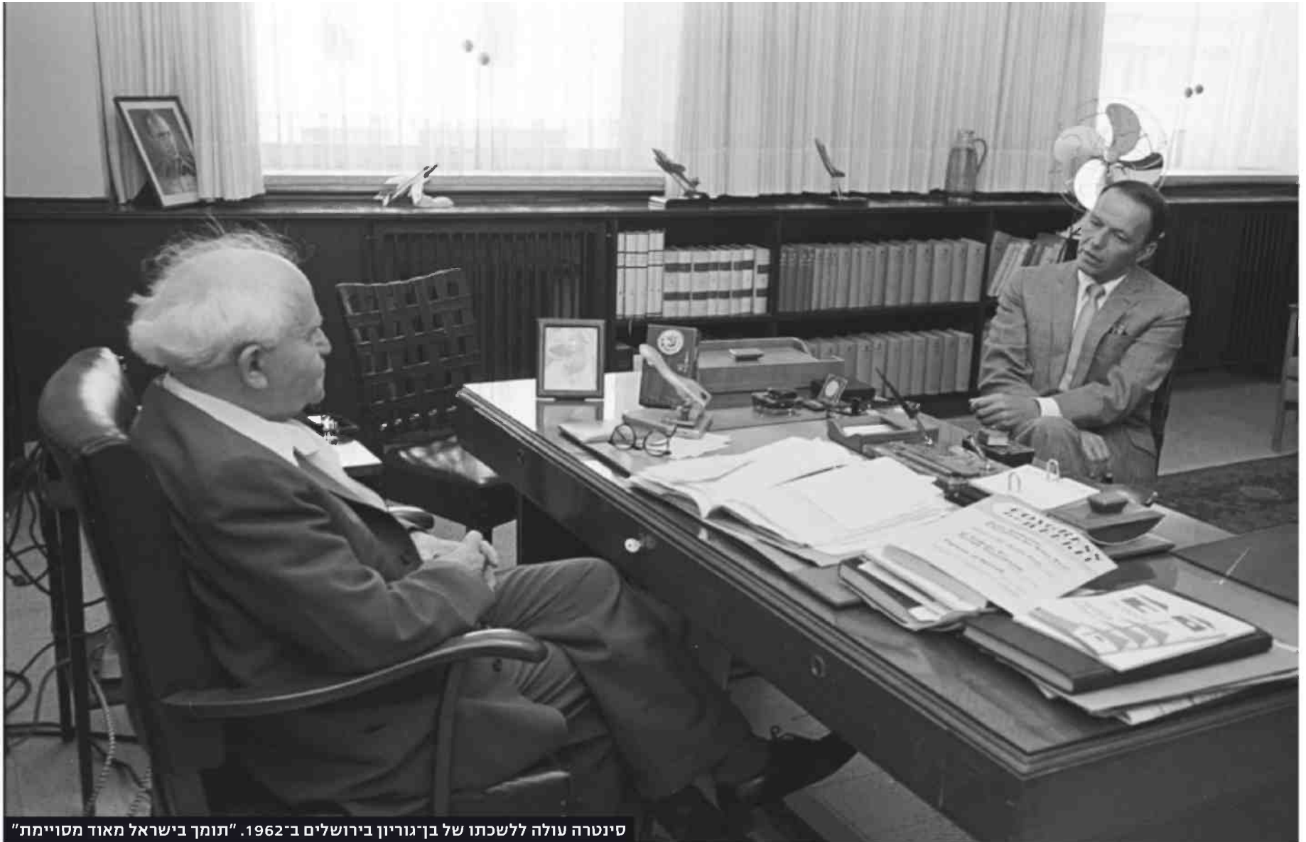
סינרטה עולה ללשכתו של בן-גוריון בירושלים ב-1962. "תומך בישראל מאוד מסויימת"