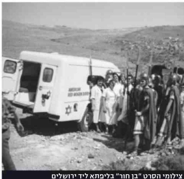
צילומי הסרט "בן חור" בליפתא ליד ירושלים