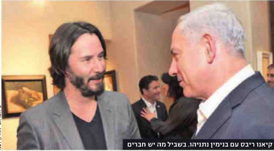
קיאנו ריבס עם בנימין נתניהו. בשביל מה יש חברים