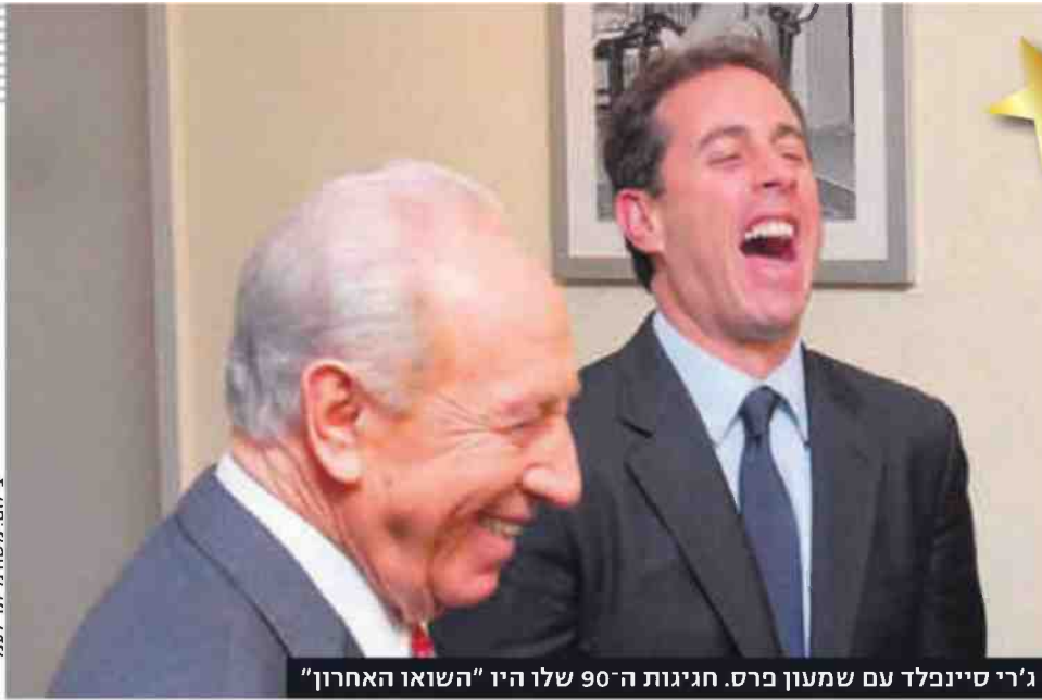
ג'רי סינפלד עם שמעון פרס. חגיגות ה-90 שלו היו "השואו האחרון"