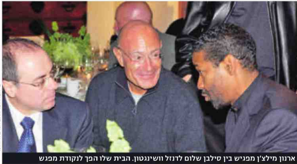
ארנון מילצ'ן מכניס בין סילבן שלום לדנזל ושינגטון. הבית שלו הפך לנקודת מפגש

להגיע לפה. אפילו ג'יין פונדה, שהייתה ביי קורתית מאוד כלפי ארצות-הברית במלחמת ויטנאם, מבקרת חיילים ישראלים ליד ביירות בזמן מלחמת לבנון, ועוד בליווי צה"ל.