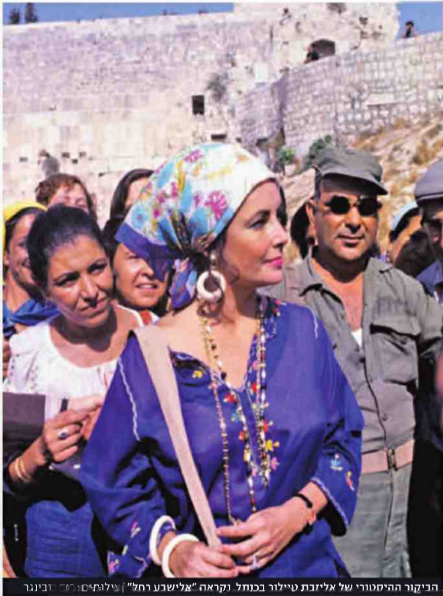
הביקור ההיסטורי של אליזבת טיילור בכותל וקראה "אלישבע רחל"