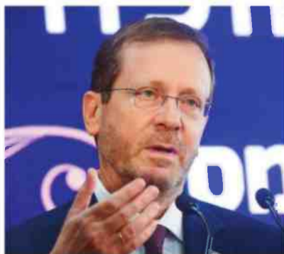
הנשיא הרצוג. ייפגש עם בכירי ממשל שונים

לרגל פתיחת הכינוס בבזל אמר הרצוג: "125 שנה לקונגרס הציוני הראשון בבזל הוא ציון דרך היסטורי, שהיה אירוע מכונן עבור העם היהודי והאנושות כולה. הציונות היא השילוב האידיאלי בין