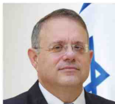
חגואל. אתגרי העם היהודי

אלפי מועמדויות ובקשות שהגיעו לוועדה. הנשיא הרצוג ינאם בערב גאלה מיוחד שבו ישתתף גם ראש ממשלת קנטון בזל ביט יאנס, וכן נשיא שווייץ לשעבר ושר הכלכלה הנוכחי גאי פרמלין.