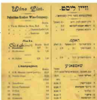
בתפריט בבאזל – יין כשר מראשל"צ