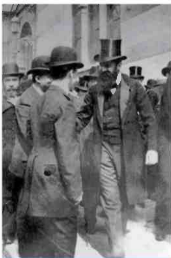
הרצל בבאזל

הסוציאלי-דמוקרטים, שהיסטורית היו פרו-ציונים, הפכו גם הם בהדרגה לאנטי-ציונים ואנטי-ישראלים. כפי שכתב פרופ' רוברט ויסטריך באחד מספריו: הם עבדו "מאמביוולנטיות לבגידה". בעוד היהודים, בייחוד ב"ישראל, נוטים לשכוח את הציונות, וגם אם זוכרים – לא תמיד מבינים, מסכיב נויש כוחות מדיניים שלא שוכחים את התורה האנטי-ציונית. מתוך הזרמים הציוניים החילוניים בישראל צמחה הכנעניות הילידית, אך החינוכית הרבה שמגלים הישראלים החדשים, דובם מורחים, מפוררת את התורות המלאכותיות. הסיבה היא שהם פשוט יהודים ולא מחפשים צבעי הסוואה.