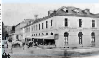
הקזינו בבאזל שבו נערך הקונגרס הציוני