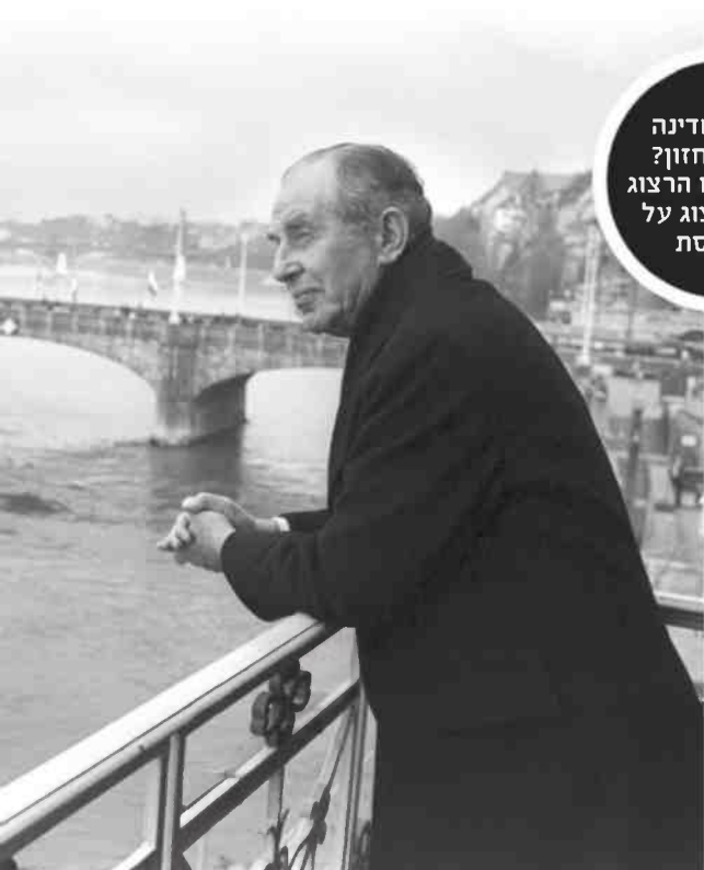
איפה המדינה ואיפה החזון? הרצל, חיים הרצוג ובוז'י הרצוג על המרפסת