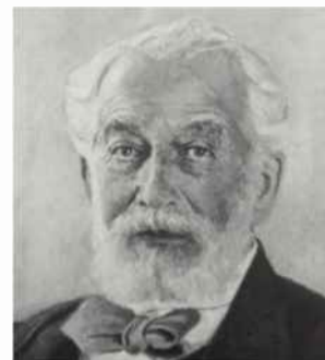
אדמונד ג'יימס רוטשילד