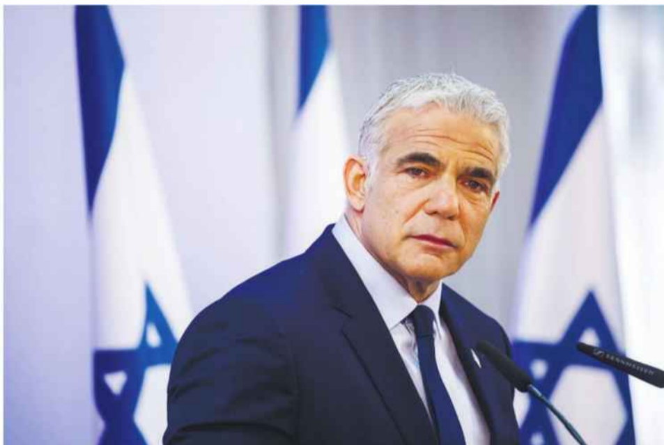
ראש הממשלה יאיר לפיד. לא פוצה פה