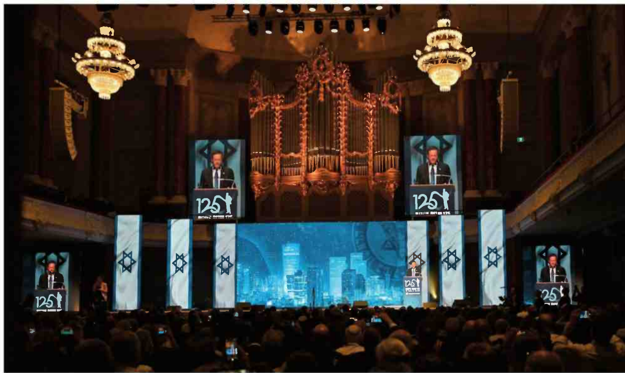
הנשיא יצחק הרצוג נואם בכנס "125 שנה לקונגרס הציוני באזול"

הרצל עמד שוב ושוב על כך שדווקא בעידן ההתפתחות הטכנולוגית האדירה והעושר שהיא מייצרת, נותר חלק גדול מהציבור עני ומרושש. בניגוד לטכנו-אוטפיים בני זמנו ובני זמננו, אצל הרצל התקדמות המדע והטכנולוגיה אינה מספיקה כדי להבטיח שגשוג חברתי. דרושה מעורבות של המדינה כדי להבטיח שהטכנולוגיה תשרת את האדם