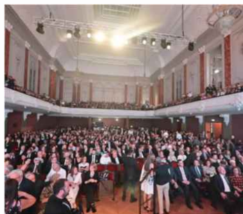
2022, הכנס בבאזל

חרתנו על דגלנו פרויקטים שאחרים התייחסו אליהם בביטול, כגון שכנועה של ארה"ב להעביר את שגרירותה לירושלים, או הבאת כל יהודי צעיר בעולם לביקור ביכורים בישראל. גרמנו לכך להצליח כי החשבנו רק את מה שחשוב, התעלמנו מכל היתר