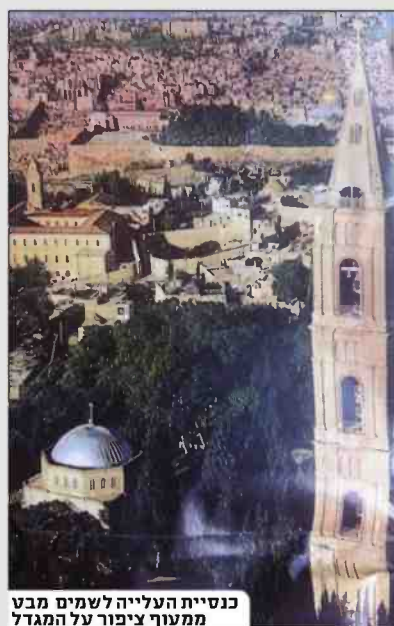
כנסיית העלייה לשמים מבט ממעוף ציפור על המגדל

חשובה לנצרות וכישתו של מרבית הר הזיתים, והוא עשה זאת חרף כל הקשיים שהערימה הביורוקרטיה הטורקית. לפי האמונה הנוצרית, מהר זה נכנס ישו לירושלים בשבוע האחרון לחייו ומכאן עלה