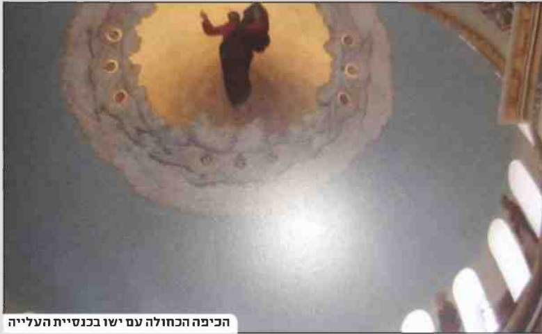
הכיפה הכחולה עם ישו בכנסיית העלייה