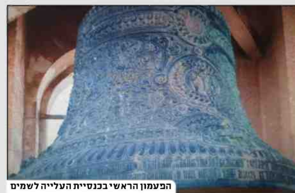
הפעמון הראשי בכנסיית העלייה לשמים