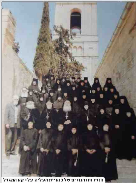
הנזירות והנזירים של כנסיית העלייה על רקע המגדל