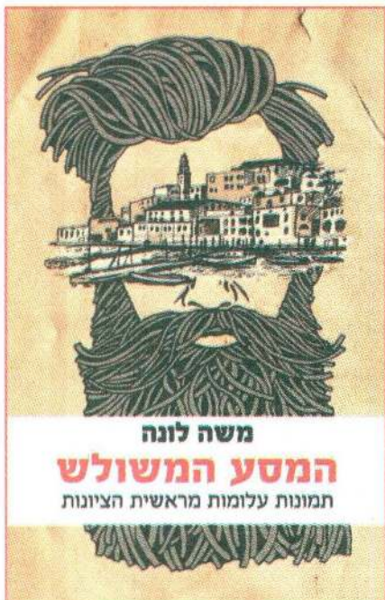
"המסע המשולש - תמונות עלומות מראשית הציונות" מאת משה לונה

מוצא דמיון רב בין פיתוח התוכנה לתהליך הכתיבה של ספרו. לדבריו, גם תוכנות מספרות סיפור, רק ששם הדרמה לא מתרחשת בטקסט אלא בחדרי הישיבות. "למרות שמדובר בספר הביכורים שלי הרגשתי נוח מאוד עם טקסטים ארוכים, עם הזנות של טקסטים מעלה ומטה, עריכה בלתי פוסקת של פסקאות, אינספור גרסאות, אך בעיקר ההכרה שלפיה הטקסט לא יהיה מושלם לעולם, אבל טוב מספיק על מנת לשחררו לעולם, ממש כמו בתוכנה".