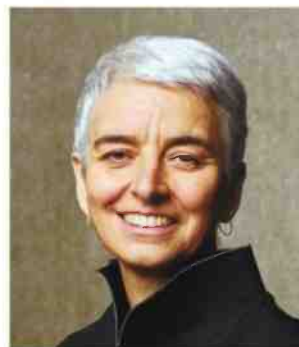
הטי ברג. רוח חדשה