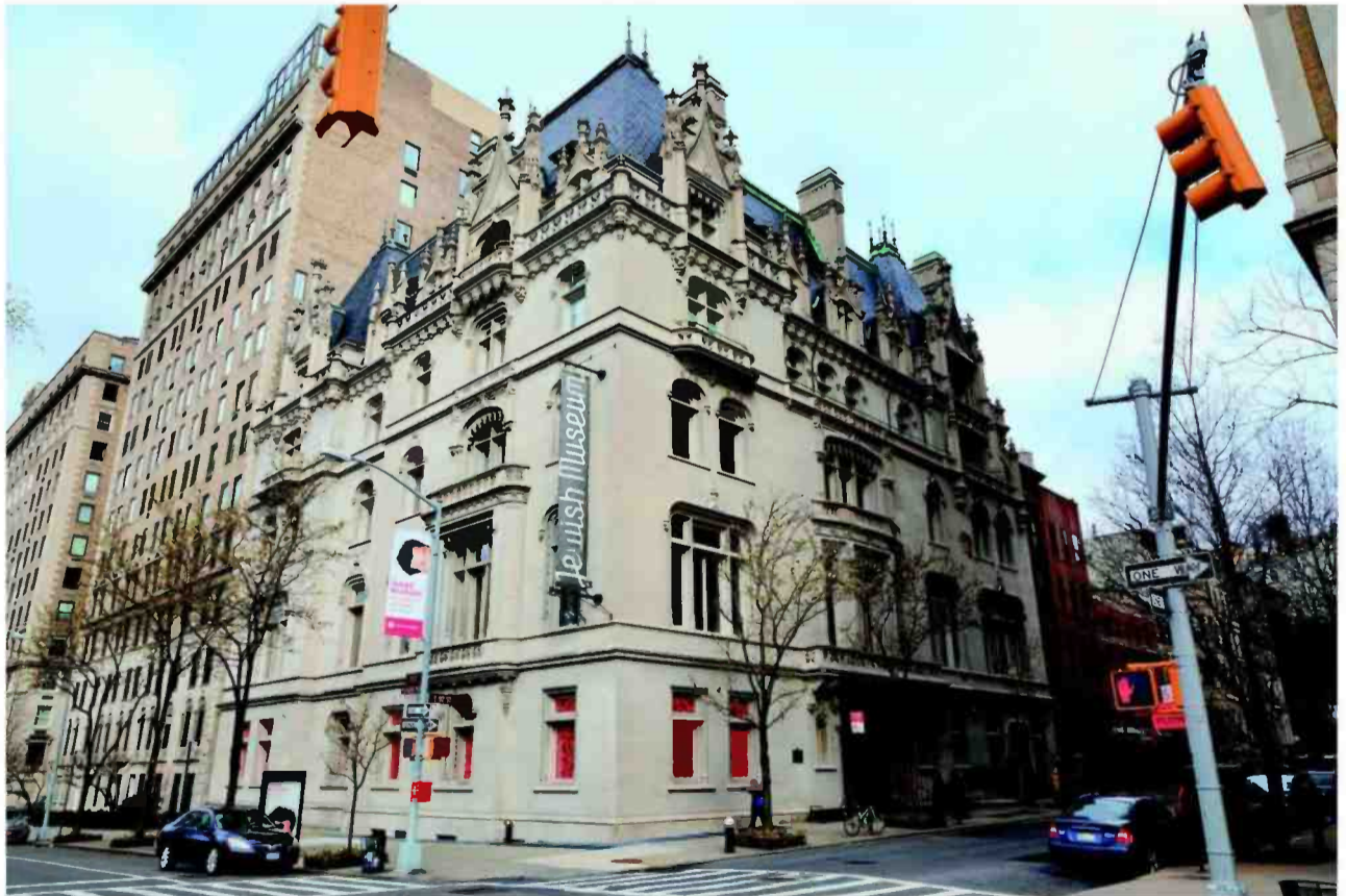
המוזיאון היהודי בניו יורק. הראשון שהחליט לשלב אמנות בתצוגה

המוזיאונים בוורשה ובכרליין הם חלק מגל של מוזיאונים חדישים. המוזיאון בכרליין ממשיך את גל האדריכלות שהביא מוזיאון הגוגנהיים