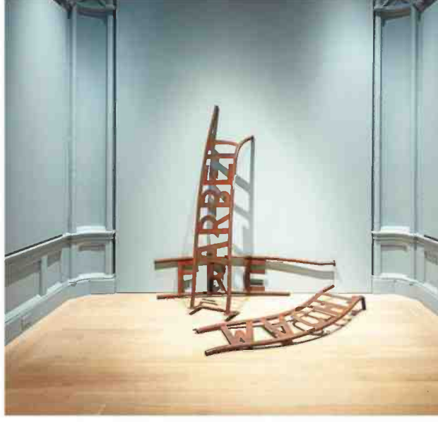
מתוך התערוכה של יונתן הורביץ בניו יורק. "לבנות עולם חופשי"