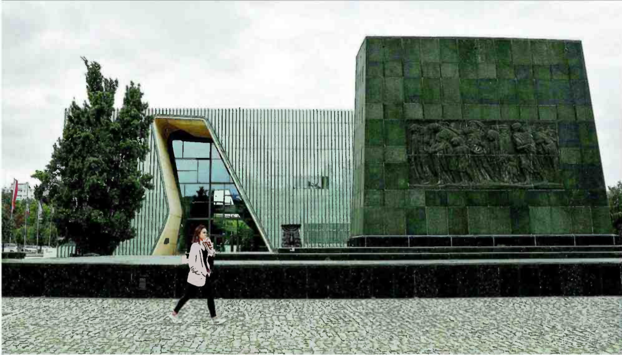
המוזיאון היהודי בוורשה. כיצד יהודים חיו, ולא רק כיצד מתו