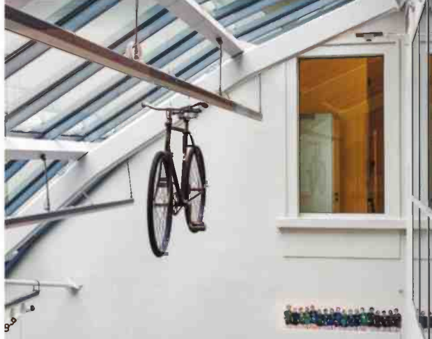
האופניים של הרצל מוצגים במוזיאון היהודי בווינה