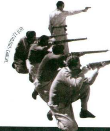
מק"י צוטטת את ישראל

לאחר תום מלחמת העולם השנייה התאחדו הכוחות הלוחמים של היישוב – ההגנה, האצ"ל והלח"י – ופעלו במשותף במסגרת תנועת המרי נגד ממשלת המנדט שהגבילה את העלייה ואת ההיאחזות היהודית בארץ. אחרי כעשרה חודשים של פעילות משותפת התפרקה החבילה והאיבה בין הצדדים חזרה