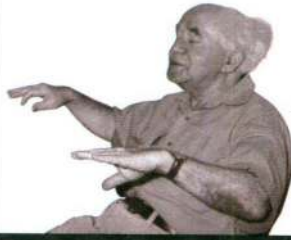
ת"י ז'אנלס ווטס

כשם שהמרכז מבטא הסכמות הוא גם מבטא את דחיקתן של עמדות אחרות אל מחוץ למעגל ההסכמה. במגעים להקמתה של הקואליציה הראשונה טבע בן-גוריון את הסיסמה בלי חרות ומק"י, ואף דחה קואליציה עם מפלגת הפועלים המאוחדת מפ"ם ובחר לחבור דווקא לחזית הדתית ולרשימות עדתיות וערביות