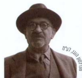
מנחם בגין, לע"מ

בראשית הציונות לא השתרעה המחלוקת בין ימין לשמאל אלא בין המזרח למערב. יהודי מזרח אירופה בראשות אחד העם תמכו בהתיישבות בארץ ישראל ובהקמת מרכז רוחני יהודי בארץ, ואילו יהודי מערב אירופה ראו את עיקר הציונות ביצירת מסגרת מדינית. אחרי פטירתו של הרצל הוביל חיים וייצמן לאימוץ שתי המגמות והשתמש במושג ציונות סינתטית