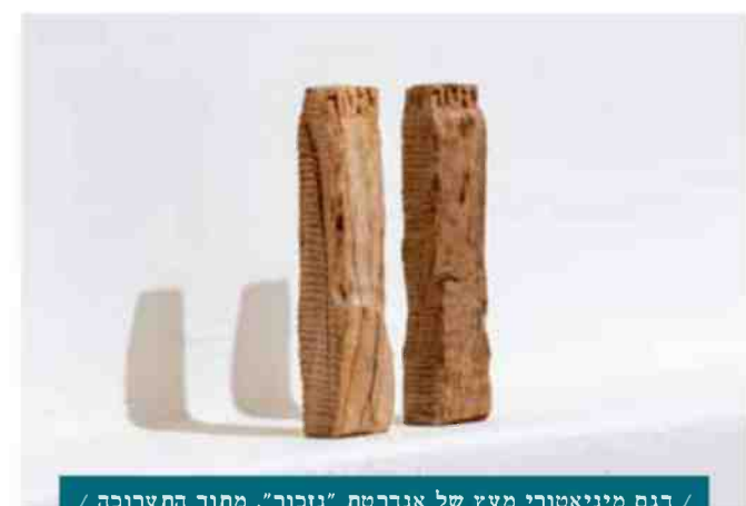
/ רגם מיניאטורי מעץ של אנדרטת “זכור”. מתוך התערוכה /