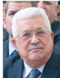
אבו מאזן. היום שאחרי ככר כאן

למסקנה הזו אני לא רוצה לחכות עוד עשרות שנים. האינתיפאדה השנייה הייתה כתובה על כל הקירות וסירבנו להבין את זה. אהוד ברק, הוא אבי האמירה 'אין פרטנר', שהיא לא מושג לגיטימי - כי הוא מטיח אשמה בצד השני. הוא היה גאה בכך שבנה יותר התנחלויות מנתניהו וזה השפיע על הפרטנר, הוא איבד את האמינות אצלו. כפי שערפאת לא לחם בטרור והרס את האמינות בעיני הישראלים. אני עד היום לא מבין אם נתן את הצהרתו מטעמים פוליטיים ואין ספק שזו ההתבטאות ההרסנית ביותר כלפי השמאל הציוני. המחנה הזה נהרס בעקבות ההתבטאות הזו."