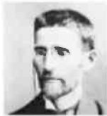
אליעזר בן יהודה

הטיוטות, שהיו חלק מעיזבונו של בן יהודה, נמכרו במרוצת השנים לאספנים בירושלים ובמרוצת השנים שהבינו את חשיבותן ההיסטורית. הדרך שנחשף כאן מוחזק אצל אספן אמנות וממוסגר בביתו בין החתימות של חוזה המדינה הרצל והגב דבן משה מונטיפיורי.