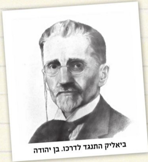
ביאליק התנגד לדרכו. בן יהודה