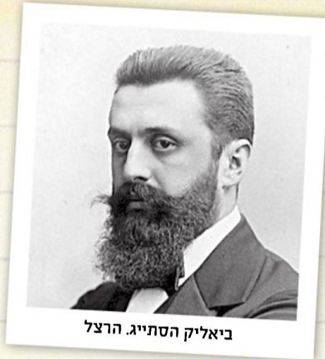
ביאליק הסתייג. הרצל

חוקר הספרות שמואל אבנרי: "כשנשאל ביאליק מדוע הוא מרבה לעסוק בעניינים סוציאליים וציבוריים, במקום להרבות יותר בכתיבת שירים, השיב: 'מי זה הדיין שיכריע ויאמר מה עריך, אם שיר טוב או מעשה טוב'"