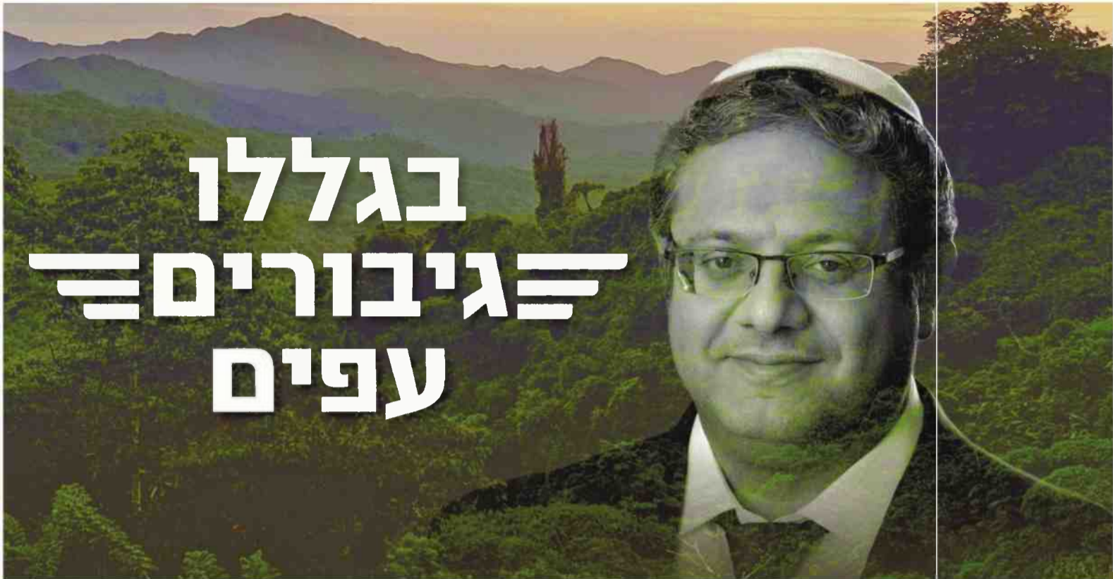
צילומים: הדמוקרטיה תנצח - כרזות מחאה

לדבר גם לקהלים אחרים". אסי, קופירייטר שהצטרף לקבוצה, אומר שהעבודה על הכרזות "סייעה לשחרר כעסים על מה שקורה ואיפשרה להוציא מהעצבים האלה כרזות משעשעות". הוא יצר את הסיסמה "חייג 100, קבל 0", כשברקע מופיעה דמותו של בן גביר. דמותו בולטת בעוד כרזה, לצד הסיסמה: "בגללו גיבורים עפים", פרפראזה על הספר והסדרה "בשבילה גיבורים עפים". הסיסמה נהגתה לאחר הדחתו של מפקד מחוז תל אביב במשטרה, עמי אשד. "בן גביר הוא דמות שמושכת בימים אלה הרבה רעל, או גם מאוד קל למצוא איך לתעל את זה לכרזות", אומר אסי. סיסמה נוספת