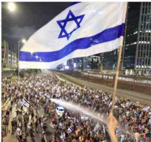
אקט לא מודע של הסכמה? מחאה נגד הרפורמה בת"א