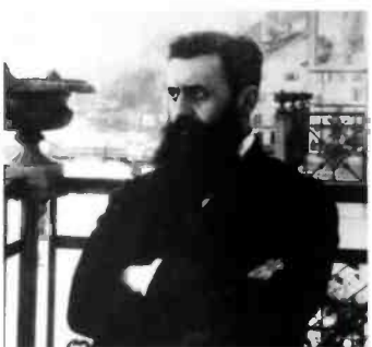
נטל את כובע המעצב. הרצל

"למגן דוד החלו לקרוא בשמו בעיקר סביב הפן המאגי. דהיינו, דימוי להגנה למי שנושא קמע מצויר הקרוי על שם דוד המלך. האירוניה היא שמה שתרם אולי יותר מכל לקיבועו של המגן דוד כסמל היהודים הוא שעוצב בדמותו"