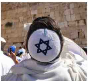
ברכת כהנים בכותל

"למגן דוד החלו לקרוא בשמו בעיקר סביב הפן המאגי. דהיינו, דימוי להגנה למי שנושא קמע מצויר הקרוי על שם דוד המלך. האירוניה היא שמה שתרם אולי יותר מכל לקיבועו של המגן דוד כסמל היהודים הוא שעוצב בדמותו"