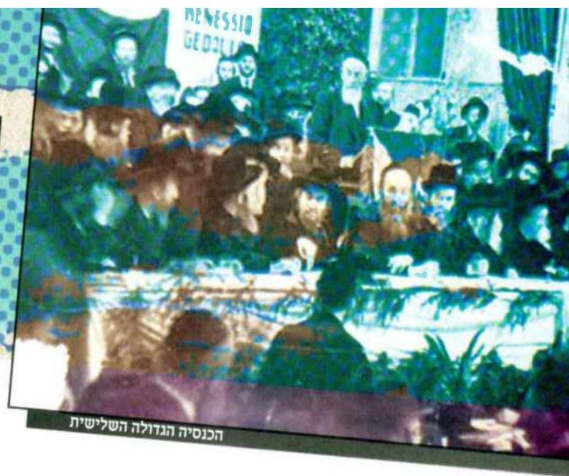
הכנסיה הגדולה השלישית

הצדדים, הגישה ועדת פיל דו"ח מסכם, הפותח במסקנה נחרצת: