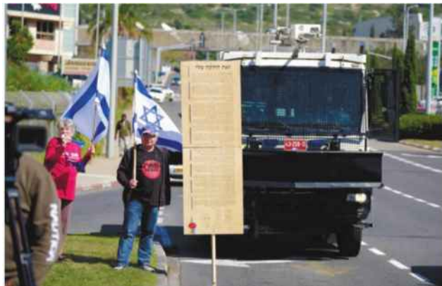
הפגנה נגד הפיכה המשטרית בחיפה, במרץ