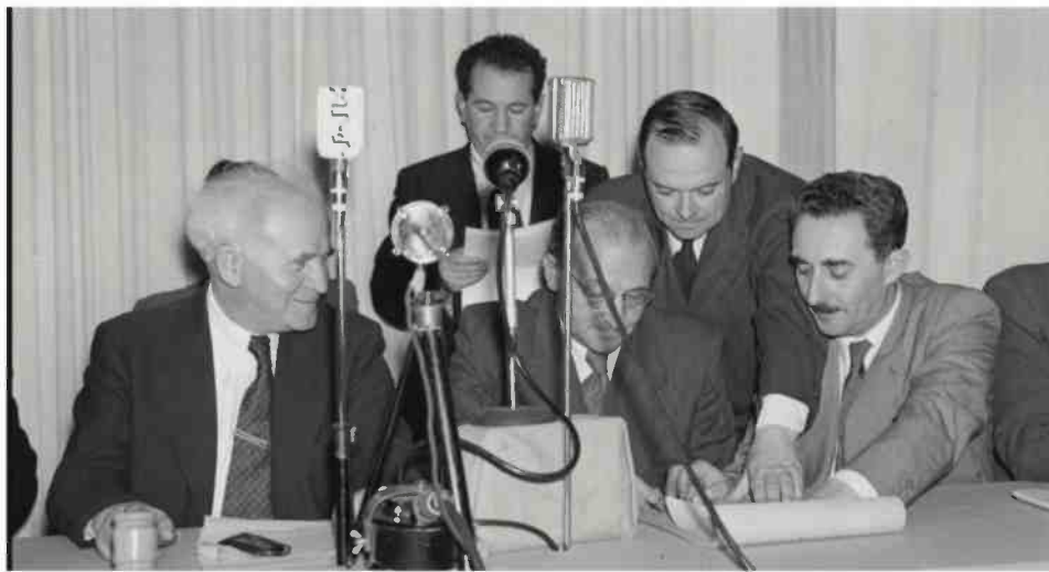
מימין לשמאל בשורה הראשונה: משה שרת, פרץ ברנשטיין ודוד בן גוריון חותמים על מגילת העצמאות, ב-14 במאי 1948

לחתום לא בחתימותיהם הרשמי מיות, אלא לעשות מאמץ ולהניח ציח את שמוותיהם במסמך ההיסטורי בכתיב ברור שניים מחברי מועצת העם היו נצורים בירושלים ואחרים היו בחוץ לארץ, וחתומותיהם הושלמו במקור מות שנשמרו ריקים על המגילה. כמה ימים אחרי הטקס פנה וליש אל הרבנות הראשית וכי קש המלצה על סופר סת"ם מנור סה, כדי שיעלה את נוסח מגילת העצמאות על הקלף שרכש ושני שמר בכספות של בנק אנגלו-פלשתינה (אפ"ק). האדם שנבחר למשימה, הרב וינשטיין, בחר כנראה בדיו לא נכון עבור מלאכת המחשבת של כתיבת אותיות כה עדינה, דבר שגרם לקלף המגילה להתכסות בכתמים רבים, שטשטש כליל את השורות. בעקבות זאת הבין וליש שעליו לביצע את המשימה בעצמו, בסיוע עוזרו רודי רודולף סינדה. הם בחרו גופן בהשראת ספרי קודש, בעל משיכות קליגרפיות של האותיות שיש להן צלעות החוררות מהשורה, כמו ל' או ק' – סג' נון טיפוגרפי שניתן למצוא בעקבות נוספות של וליש. הקלף שהוא רכש לא היה גדול מספיק, וכך שלושה חלקים נפרדים חובו רור בתפירה כדי ליצור מגילה אחת ארוכה, שהועברה בשלהי 1948 למשמרת בגנור המדינה. וליש כנראה לא יכול היה לדרוש מיין ש-75 שנה אחרי אותו מרוץ לילי אחר קלף מתאים, מגילת העצמאות תהפוך לאחד מסמלי המאבק נגד ממשלת ישראל הנרשמת כחית ולאייקון תרבותי, שמייצג את ערכי המקום ואת ערכי האנשים שחיים בו.