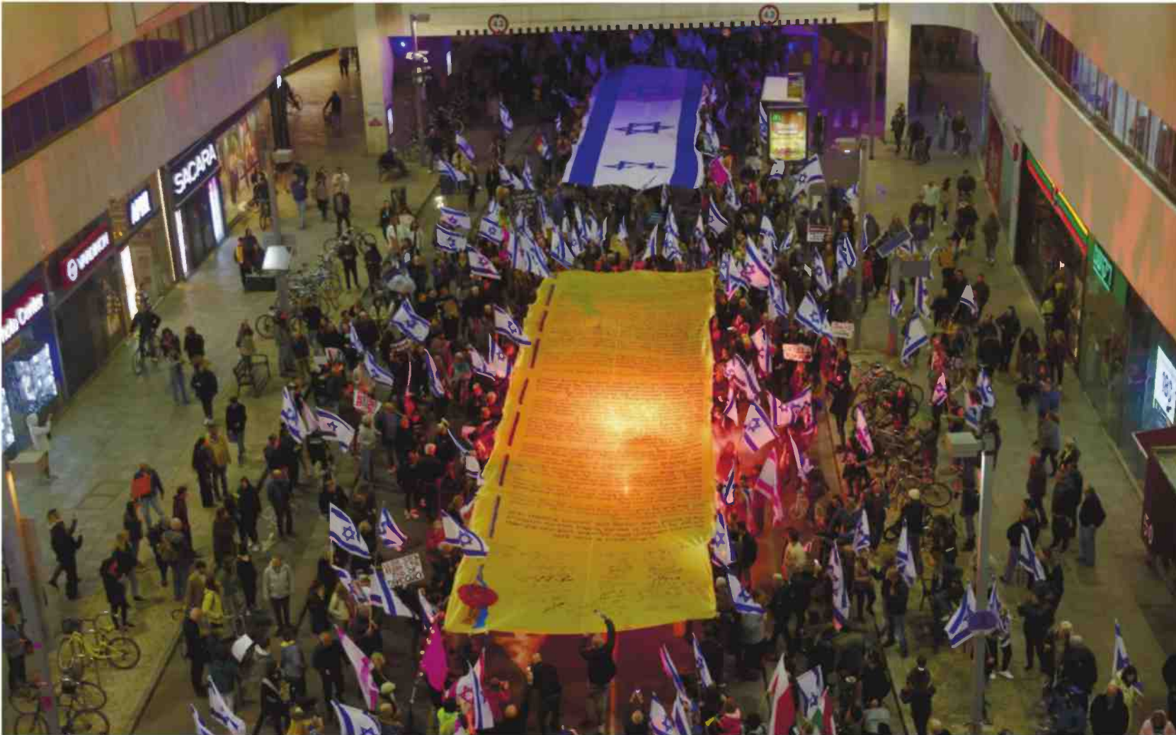
כרזה של מגילת העצמאות בהפגנה נגד ההפיכה המשטרית בתל אביב, בפברואר. סמל של ערכי המדינה

לחתום לא בחתימותיהם הרשמי מיות, אלא לעשות מאמץ ולהניח ציח את שמוותיהם במסמך ההיסטורי בכתיב ברור שניים מחברי מועצת העם היו נצורים בירושלים ואחרים היו בחוץ לארץ, וחתומותיהם הושלמו במקור מות שנשמרו ריקים על המגילה. כמה ימים אחרי הטקס פנה וליש אל הרבנות הראשית וכי קש המלצה על סופר סת"ם מנור סה, כדי שיעלה את נוסח מגילת העצמאות על הקלף שרכש ושני שמר בכספות של בנק אנגלו-פלשתינה (אפ"ק). האדם שנבחר למשימה, הרב וינשטיין, בחר כנראה בדיו לא נכון עבור מלאכת המחשבת של כתיבת אותיות כה עדינה, דבר שגרם לקלף המגילה להתכסות בכתמים רבים, שטשטש כליל את השורות. בעקבות זאת הבין וליש שעליו לביצע את המשימה בעצמו, בסיוע עוזרו רודי רודולף סינדה. הם בחרו גופן בהשראת ספרי קודש, בעל משיכות קליגרפיות של האותיות שיש להן צלעות החוררות מהשורה, כמו ל' או ק' – סג' נון טיפוגרפי שניתן למצוא בעקבות נוספות של וליש. הקלף שהוא רכש לא היה גדול מספיק, וכך שלושה חלקים נפרדים חובו רור בתפירה כדי ליצור מגילה אחת ארוכה, שהועברה בשלהי 1948 למשמרת בגנור המדינה. וליש כנראה לא יכול היה לדרוש מיין ש-75 שנה אחרי אותו מרוץ לילי אחר קלף מתאים, מגילת העצמאות תהפוך לאחד מסמלי המאבק נגד ממשלת ישראל הנרשמת כחית ולאייקון תרבותי, שמייצג את ערכי המקום ואת ערכי האנשים שחיים בו.