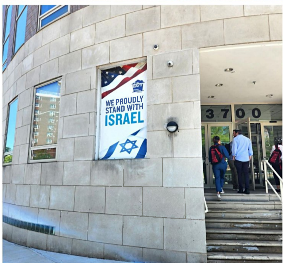
אוהבים את ישראל וגאים בה. הכניסה לישיבת "חובבי תורה"

עוד שלוש נקודות שקשורות ליחס לישראל. אחת היא סוגיית התרומות. בלב מנהטן, בבניין מרשים, יושבת "פרדציית ניו יורק". זהו מעין ארגון-על שמי גייס הכי הרבה תרומות בעולם היהודי – כ-250 מיליון דולר בשנה. 30 אחוזים מהכסף הזה מגיע לישראל לשלל ארגונים, מוסדות ותוכניות שהקרן תומכת בהם. את העובדה שמרבית התרומות שלהם מופנות לארגונים מהצד השמאלי-ליברלי בישראל, הם מסבירים בכך שהצד הימני-שמרני בשלטון רוב השנים, ולכן הוא מקבל תקציבים ממשלתיים. האם זה נכון? שאלה טובה. נקודה נוספת בקשר לישראל היא שאלת הדור