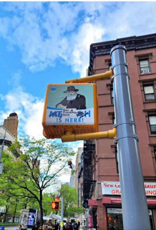
עוד זווית של העיר היהודית בעולם