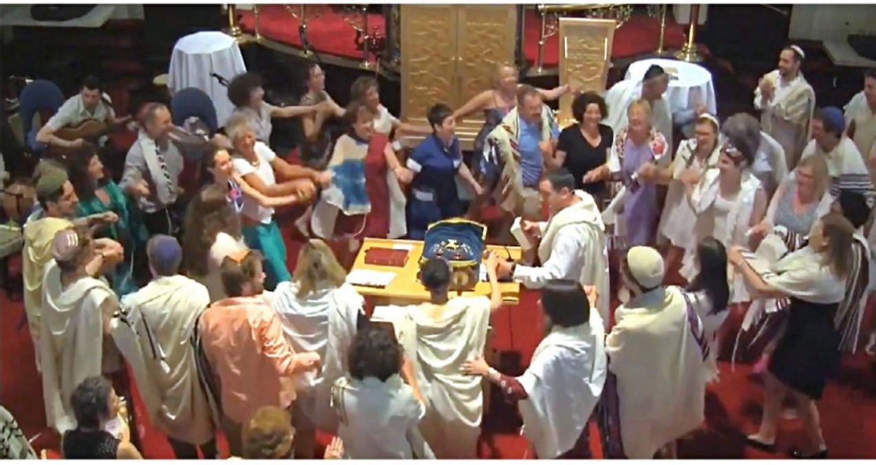
תפילה של קהילת "רוממו" בכנסייה

אם פורסים אותם על פני שנים. מה שכן מראיג אותו הרבה יותר הוא מספר האנשים שהעם היהודי מאבד בגלל התבוללות - מספר עצום שיש המכנים אותו "השואה השקטה", לעומת המספר הזעום של נרצחים בתקריות אנטישמיות לאורך השנים.