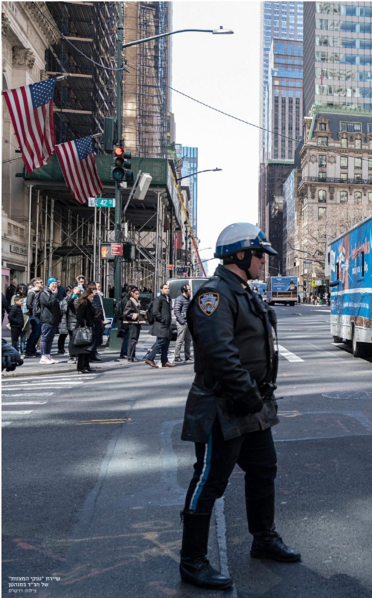
שיירת "טוקי המצוות" של חב"ד במנהטן