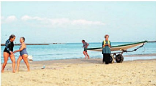
בן-גוריון השאיר פצצה. מתוך 'חילוניות' בכאן 11

ההיסטוריונית הזו שבה אחראית לאופי העשייה התייעור-דית של בריאון ושלח, וליכולת הפנומנולית למתוח חושים מקשרים בין עבר להווה, להכליא שוטים נדירים מפעם עם רגעים אקטואליים לגמרי, לעיתים במחי קאט, על אותו משפט, כפי שקורה לא פעם ב'חילוניות'. "אני מרו-