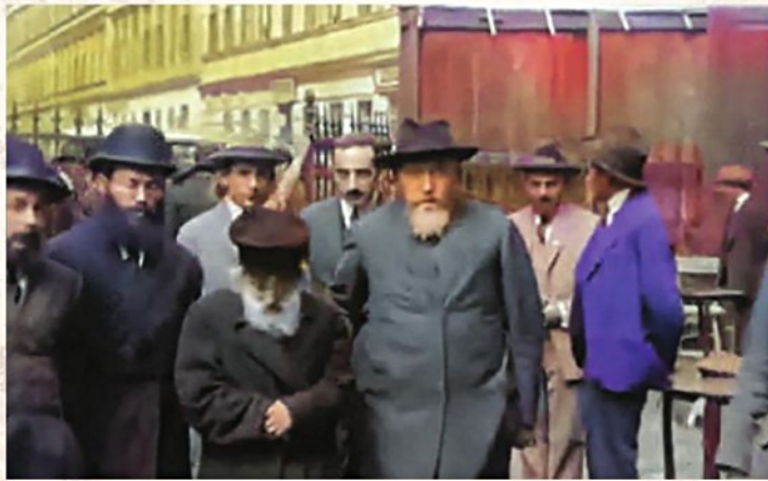
"ישיש קטן קומה וקדוש". החפץ חיים עם נכדו ומשמעו. מאחורי השער נראה גג הרכב בו נסע לראשונה