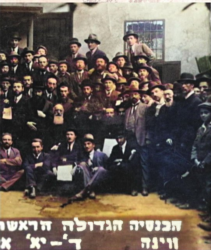
פי שלושה נציגים מהתכנון הראשוני. תמונת מזכרת מווינה