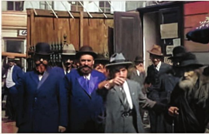
"יהודים ישמחו בכך". הגאון בעל 'הכל' חמדה' (מימין) אחרי הנס ברכבת

מלחמת העולם הראשונה פרצה בדיק יומיים לפני שהכנסייה הגדולה הייתה אמורה להיפתח. ברגע אחד נשטף חלום הכנסייה הגדולה