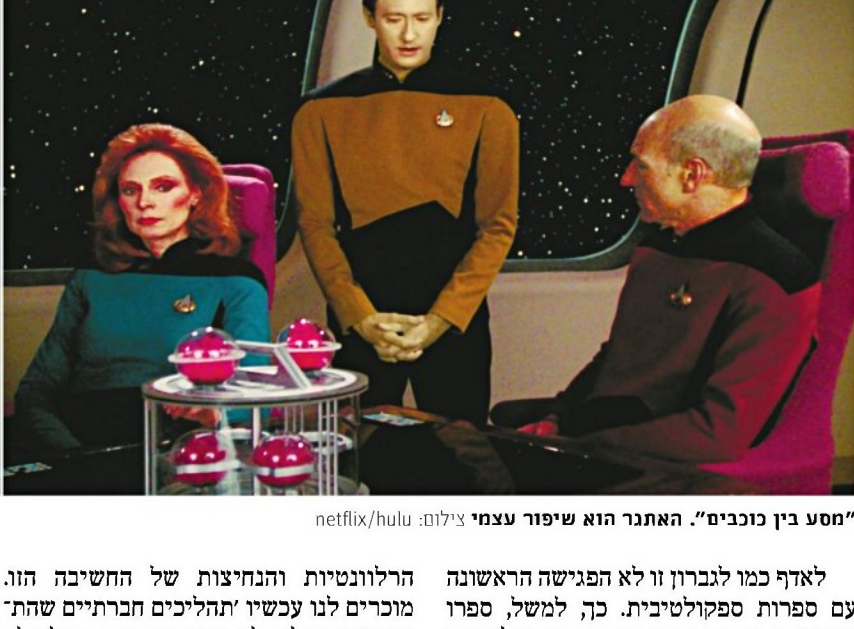
"חסע בין כוכבים". האתגר הוא שיפור עצמי

הנובלות מתפרסמות על רקע שבר חסר תקדים בחברה הישראלית, התפרורת מוחלטת. האם אתם מרגישים שהעבודה שעשיתם רלוונטית מתמיד, או דווקא להיפך? איך הפרויקט משתלב בכל מה שקורה עכשיו במדינה? "אני חושב שהנובלות רלוונטיות מתמיד. כבר כשעבדנו על הפרויקט הבנו את