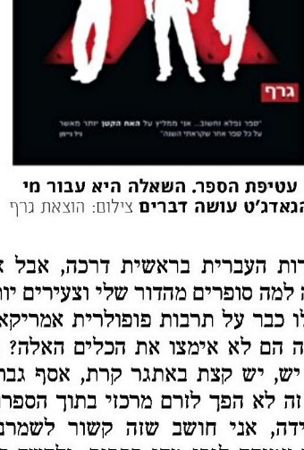
עטיפת הספר. השאלה היא עבור מי הנאדג'ט עושה דברים

אצל לה גווין אפילו השפה לא מכירה במושג "בעלות". אתה יכול לחלוק איתי את הממחטה שבה אני משתמשת", אומרת ילדה קטנה לגיבור "בידיים ריקות", במקום: "אתה יכול לשאול ממני את הממחטה שלי"