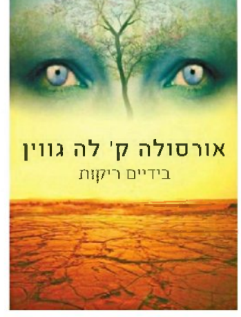
עטיפת הספר. פירוק קונספציות שמושרשות עמוק

לא תרצו הרי כל אשר סיפרתי לכם אגדה הוא, ואגדה יוסיף להיות".