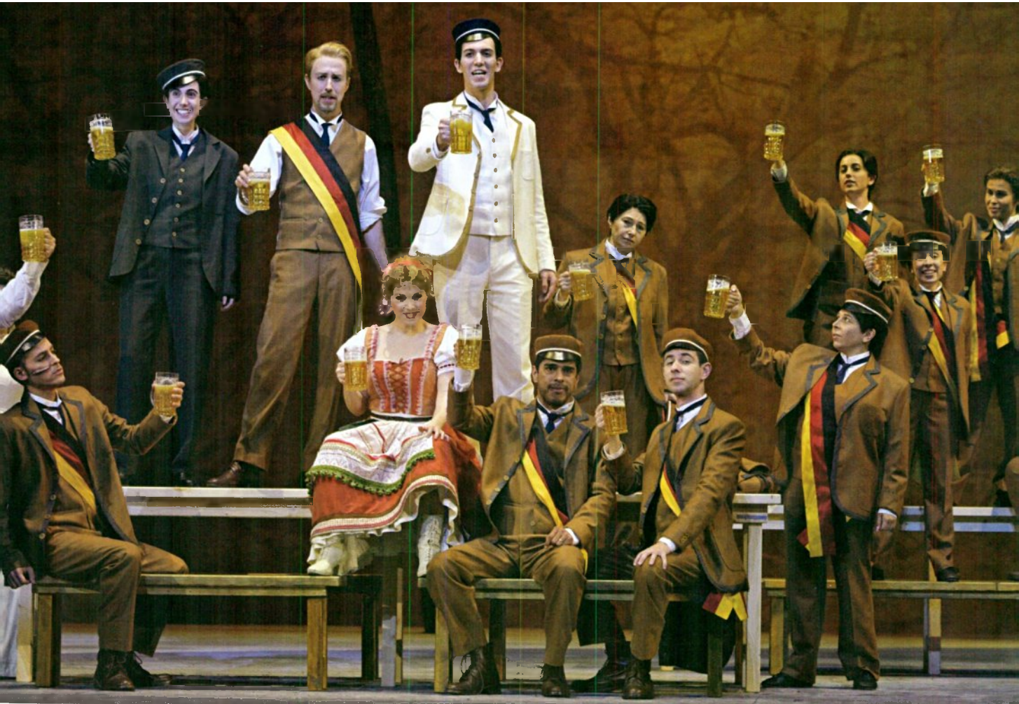
הערצה לתרבות הגרמנית. הרצל הצעיר באגודת הסטודנטים 'אלביה' צילומים: יוסי צבקר

ונחשבת לאחת האופרות החשובות שנוצרו במאה העשרים.