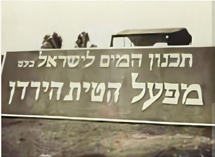
שלט המבשר על מבנל הטיית הירדן, 1953