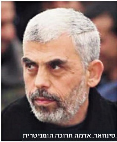
סינוואר. אדמה חרוכה הומיטרית

זו אחת הסיבות שקשה לספור את הרוגי המאס. השבוע