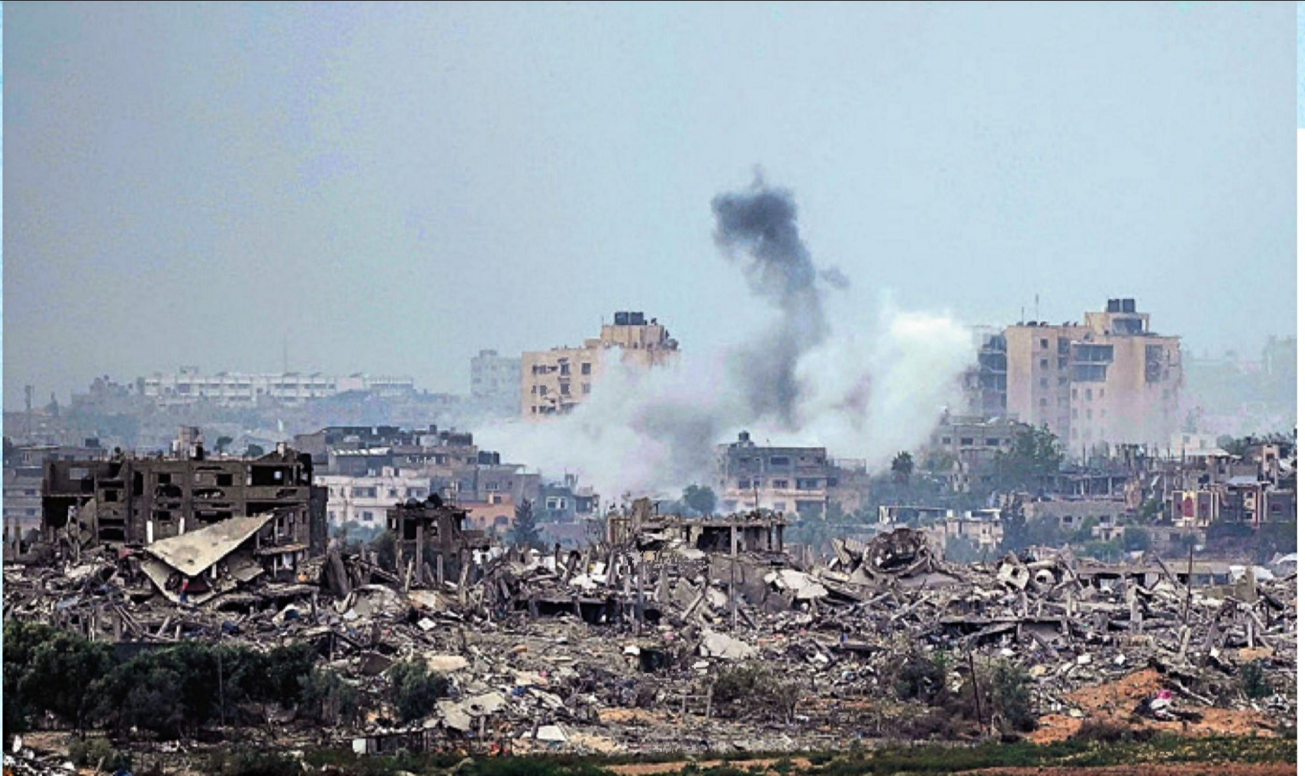
רצועת עזה, השבוע. כוחות צה"ל מייחלים לעימותים ישירים עם המחבלים, שמסתתרים בעיר המנוהרות