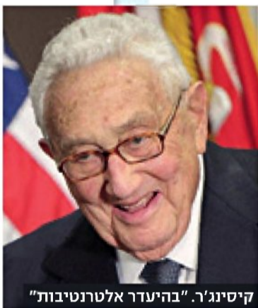
קיסנינגר. "בהיעדר אלטרנטיבות"

הרצל צדק / שלשום היה כ"ט בנובמבר. במונח מסוים, היום שבו הכל התחיל, בעצרת האומות המאוחדות ב-1947. ההחלטה על חלוקת הארץ. פרוץ מעשי האיבה והמלחמה. מים רבים נשפכו על הסכסוך הזה, והוא גבר על כולם. להבות החורבן מלחכות את כל מי שחי כאן.