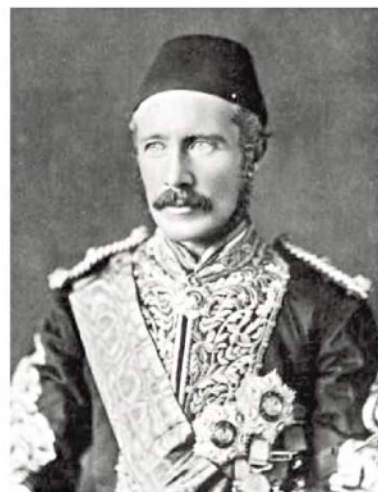
הגנרל צ'רלס ג'ורג' גורדון במדי שילט סודן

לאוליפנט, חבר הפרלמנט הבריטי, דיפלור-מט וציוני של כבוד היו תוכניות משלו: בספרו "ארץ הגלעד" (1880) הוא הציג לשלטון העיר-תמאני לסלול מסילת ברזל מחיפה עד דמשק שתתפצל דרומה לאורך בקעת הירדן עד עקבה, ועוד הציג להקים מושבת יהודים קטנה בעבר