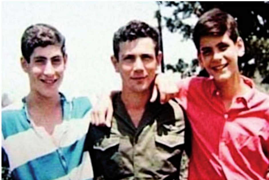
מימין: האחים עדו, יוני ובנימין נתניהו. מרירות שנשזרת כחוט השני