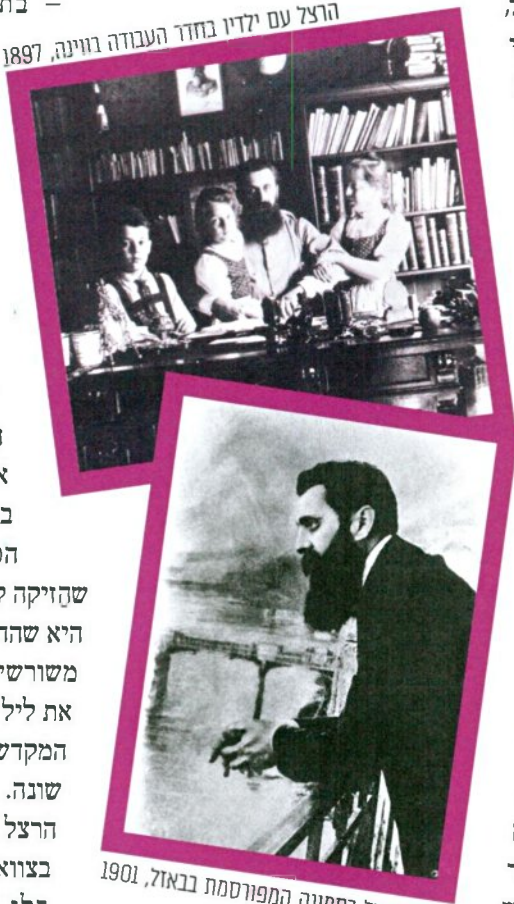
הרצל בתמונה המפורסמת בבאזל, 1901